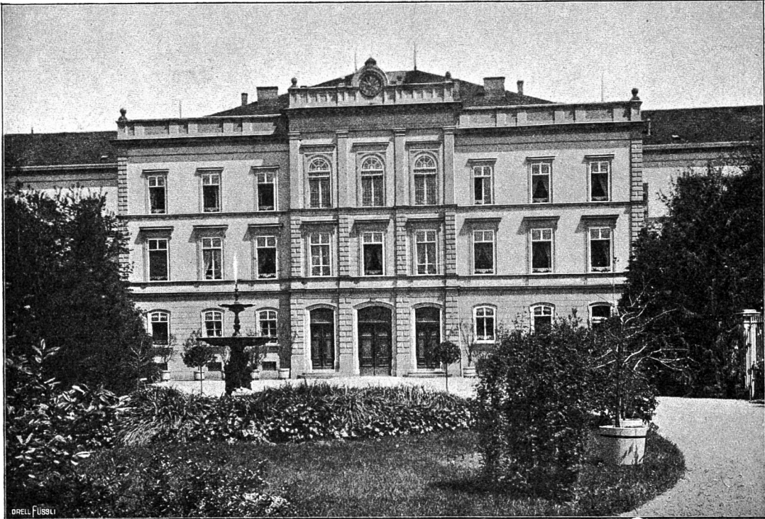
Aargauische Irrenanstalt Königsfelden.