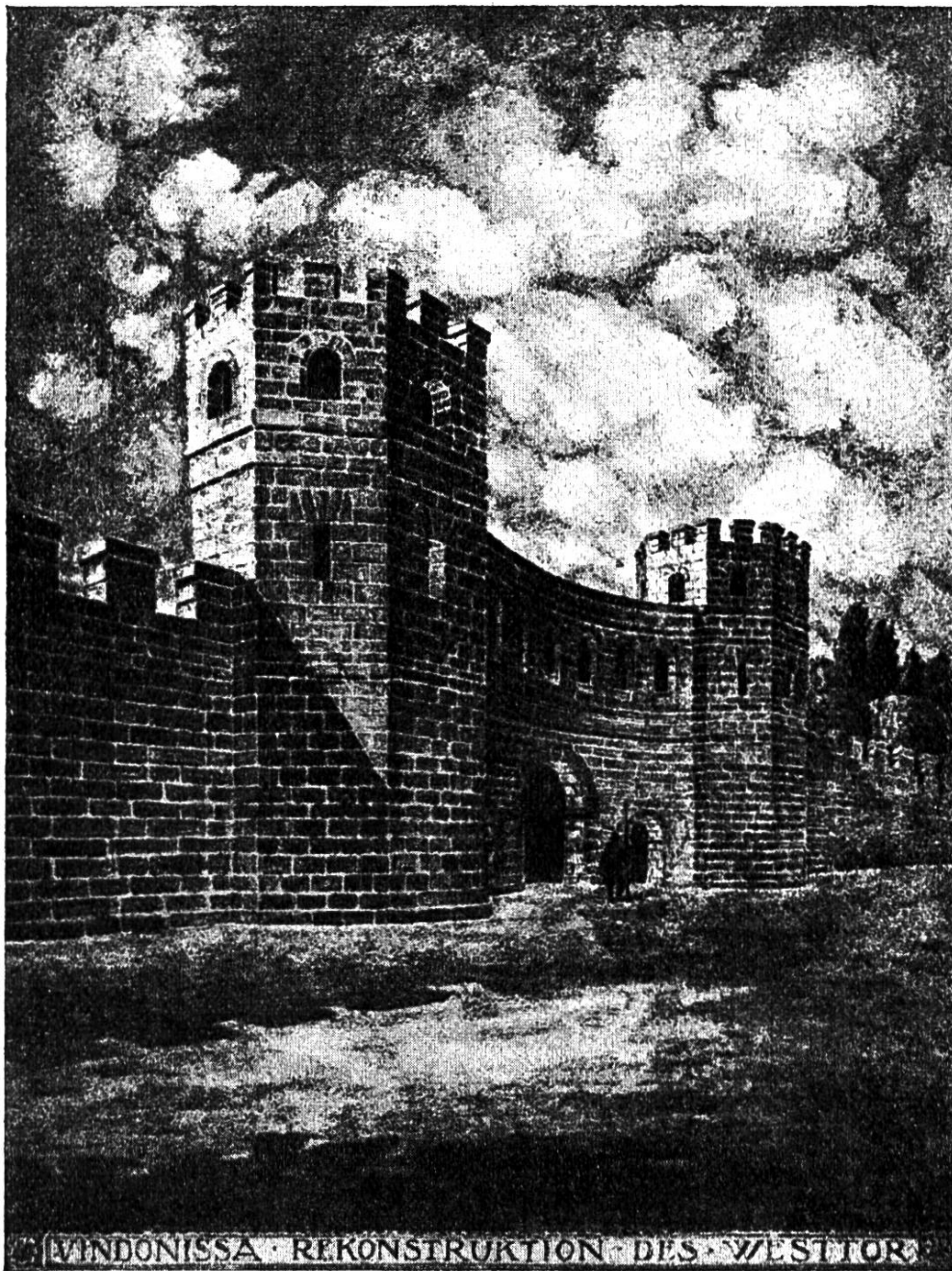
Das Westtor am Legionslager von Vindonissa.