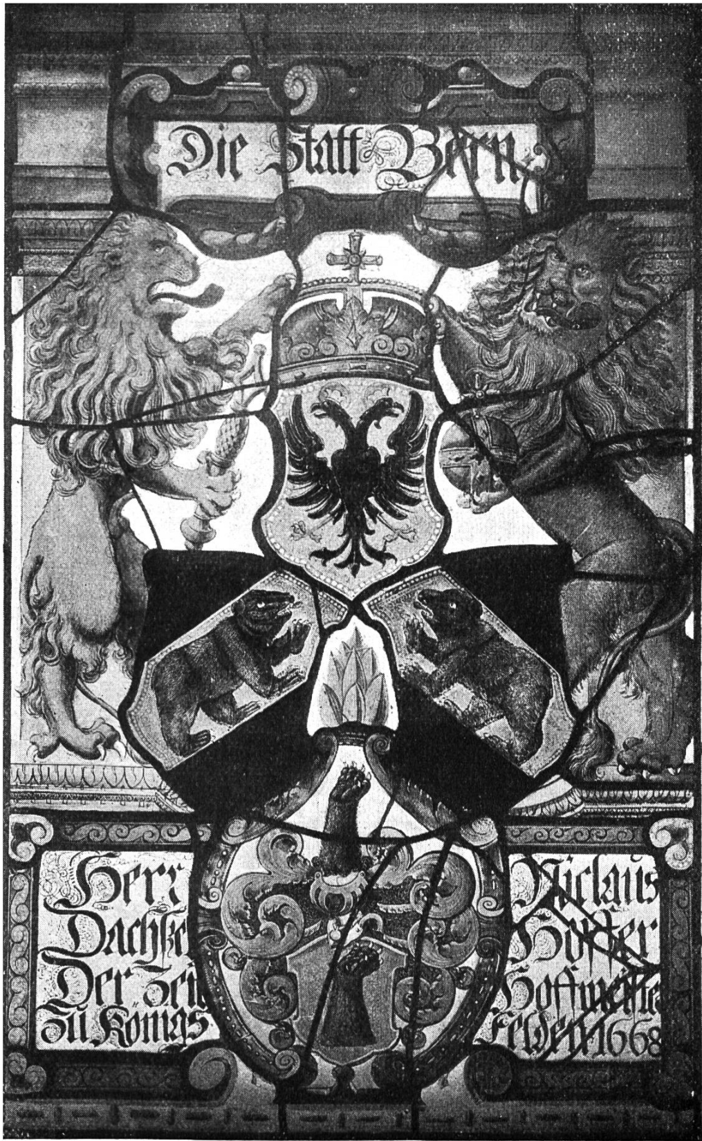
Die Dachselhoferscheibe der Kirche zu Bözén.