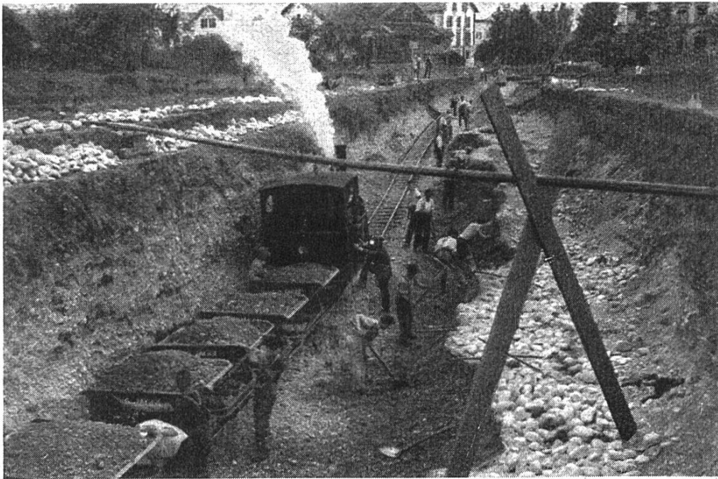
Ausheben der Zufahrtsstraße auf der Brugger Seite.

ganges gedacht war. Auch die ungefähren Kosten wurden berechnet und im Voranschlag total auf 270,000 Fr. geschätzt. Davon fielen 150,000 Fr. zu Lasten der Expropriation und 120,000 Fr. auf Konto des eigentlichen Baues.