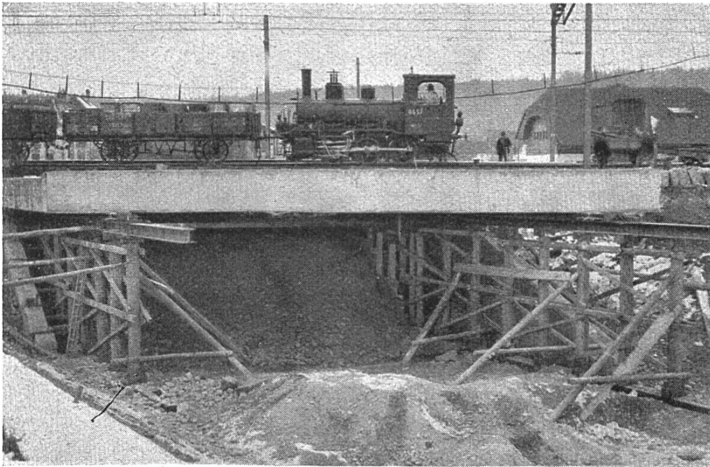
Betondecke vor dem Unterschieben.

des Bahnkörpers vorschlug. Die Gemeinde stimmte prinzipiell dem Moserschen Projekte zu, forderte aber vorerst dringend eine Erleichterung des Personenverkehrs durch Schaffung eines unterirdischen Durchganges. Einen netten kulturhistorischen Ausschnitt aus jener Zeit bietet ein Einblick in die Statistik des damaligen Verkehrs, wie er sich zwischen den beiden Seiten des Ueberganges abspielte. Danach passierten