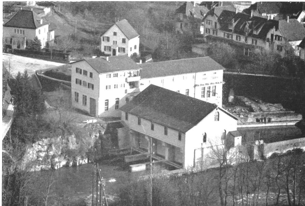
Nach dem Umbau 1940

Aufnahmen behördlich bewilligt am 10. Dezember 1942, Nr. 8016, gemäß BRB vom 3. 10. 1939