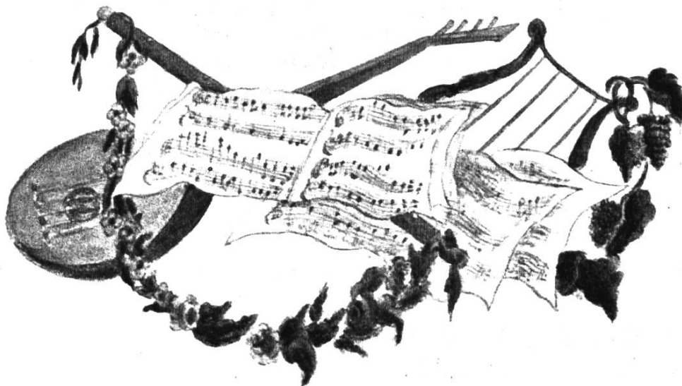
Abb. 3. Buntfarbige Vignette von Friedr. Theodor Fröhlich im Stammbuch Nieter