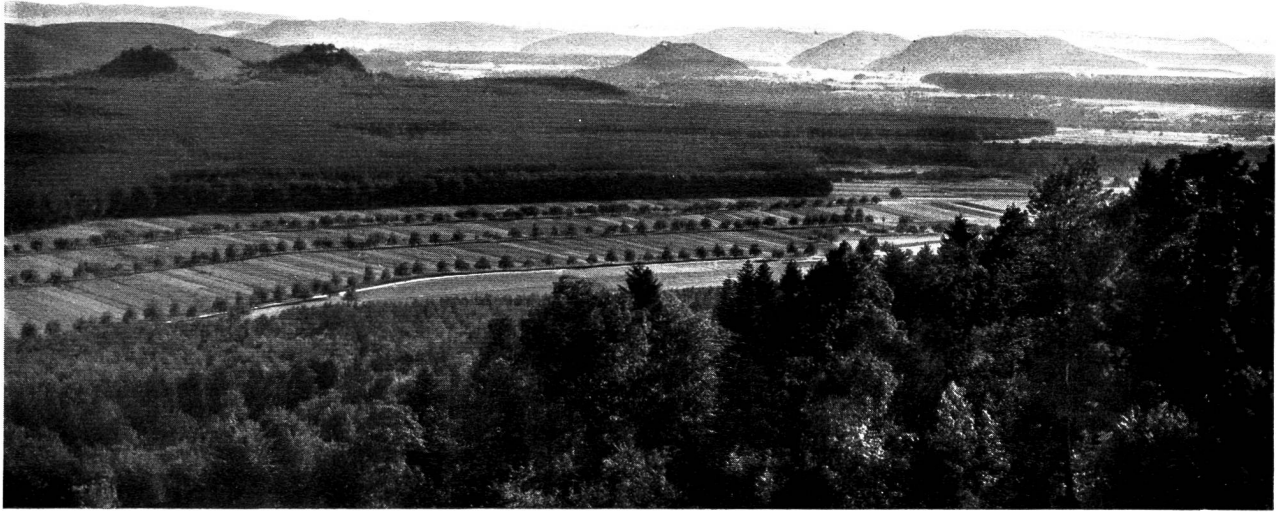
(Bilderkarung siehe Seite 16)