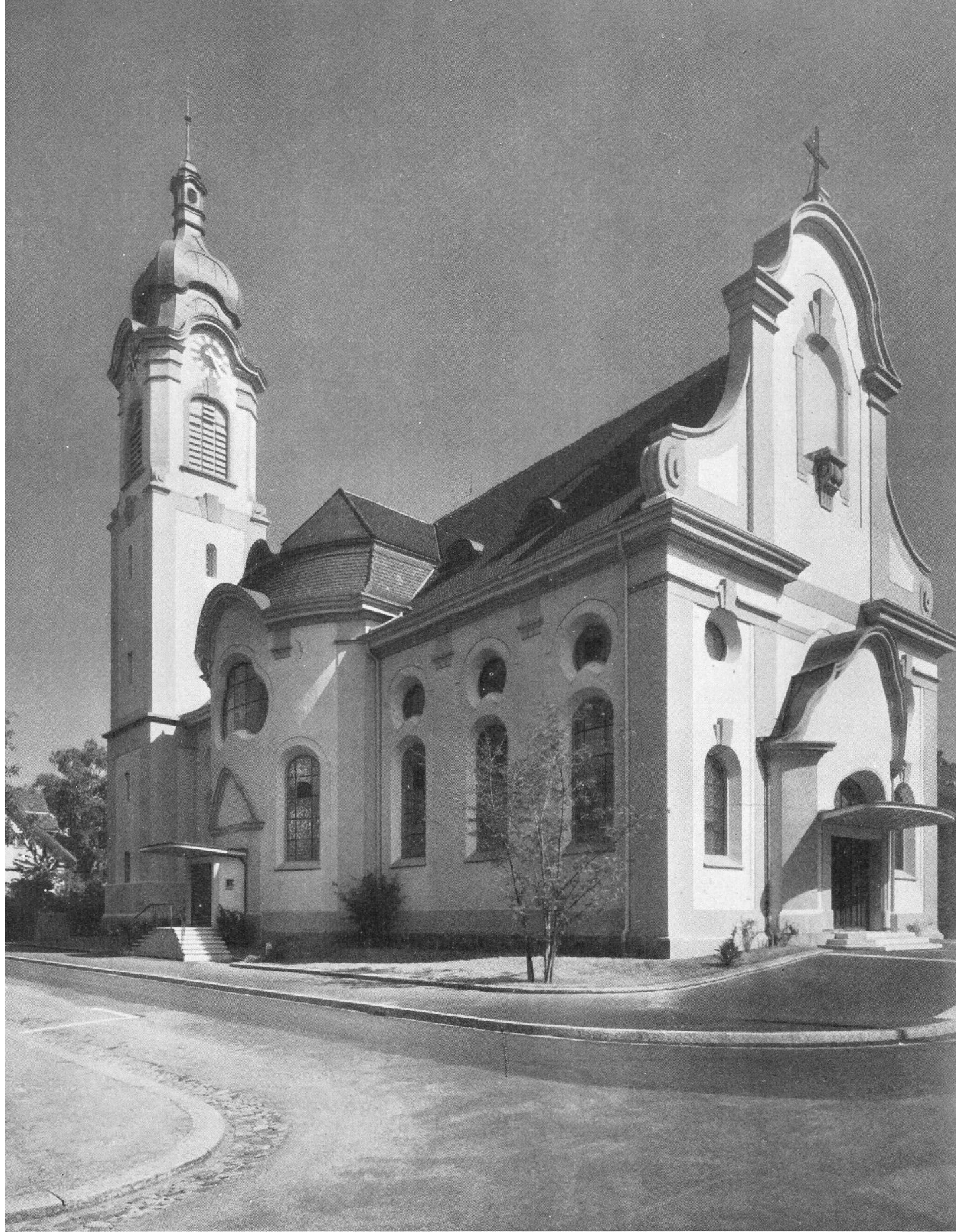
Brugg. Kath. Pfarrkirche