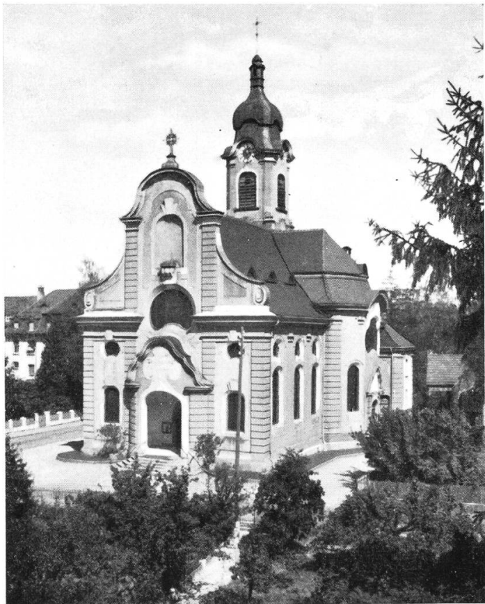
ZWEI ANSICHTEN VOR DER RENOVATION