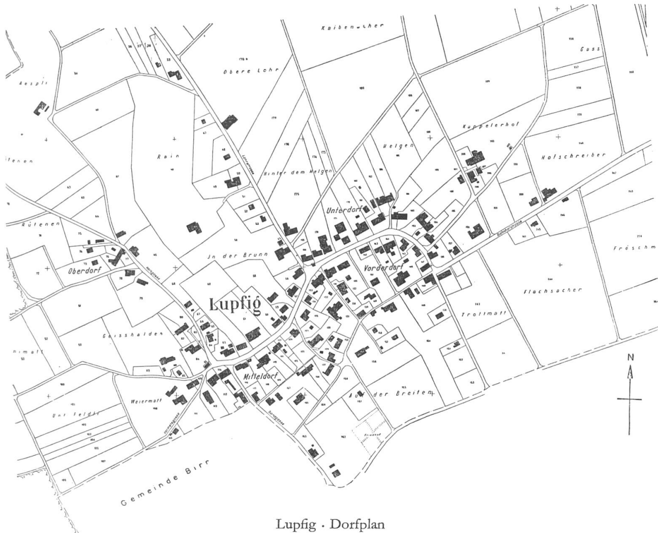
Lupfig · Dorfplan