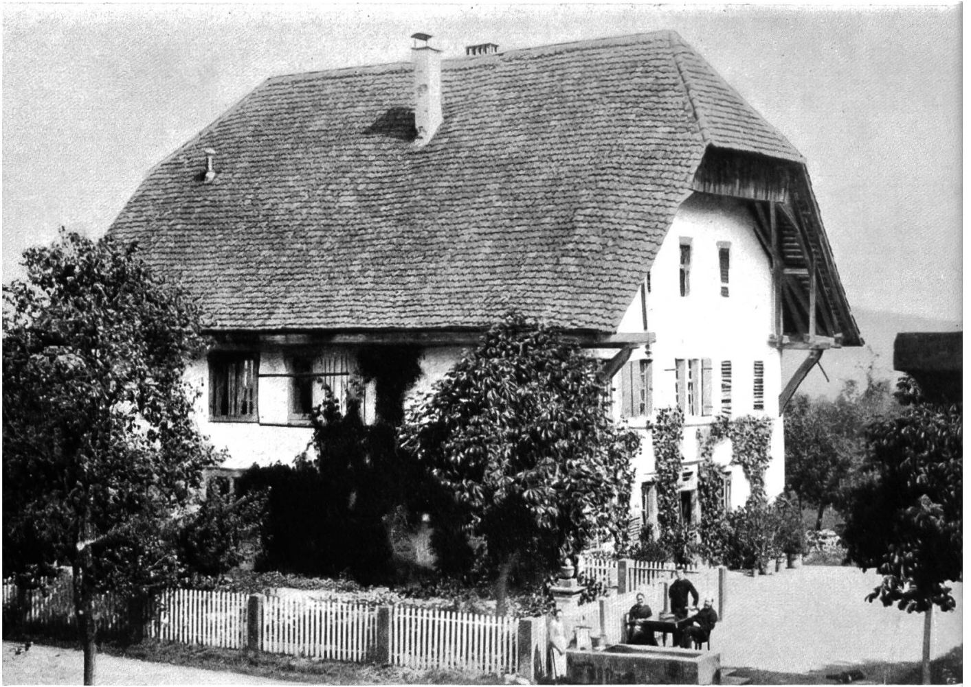
Lupfig. Altes Pfarrhaus Birr

Aufnahme im Frühjahr 1888, kurz vor dem Abbruch