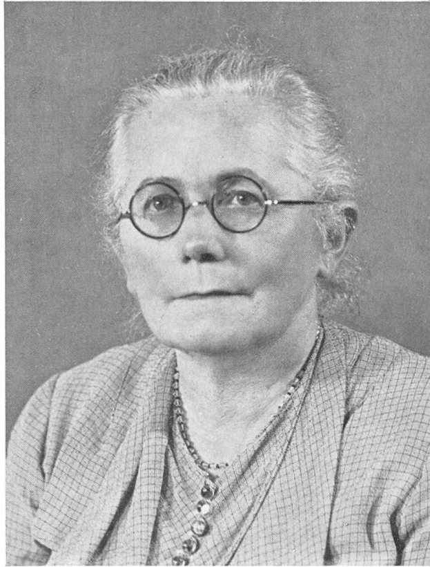
Gertrud Heuberger, 1877—1958