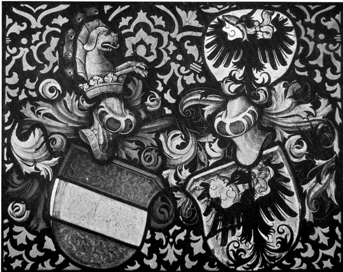
Auenstein. — Pfarrkirche. Wappenscheibe Fricker-Schad. Um 1500.