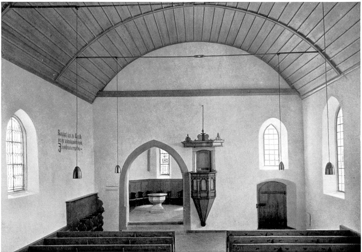
Auenstein. — Pfarrkirche, Inneres (nach der Innenrestauraton 1952)