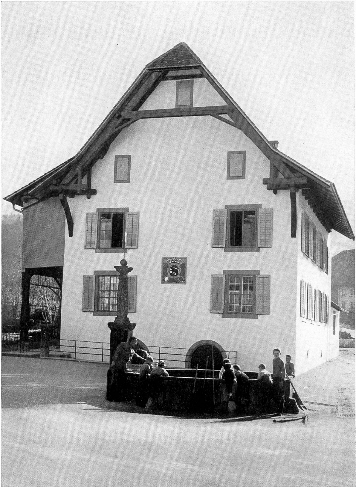
Thalheim. — Pfarrhaus, erbaut 1731/32. Nach der Restaurierung 1960/61 Dorfbrunnen Aufnahme Inventarisation der aarg. Kunstdenkmäler