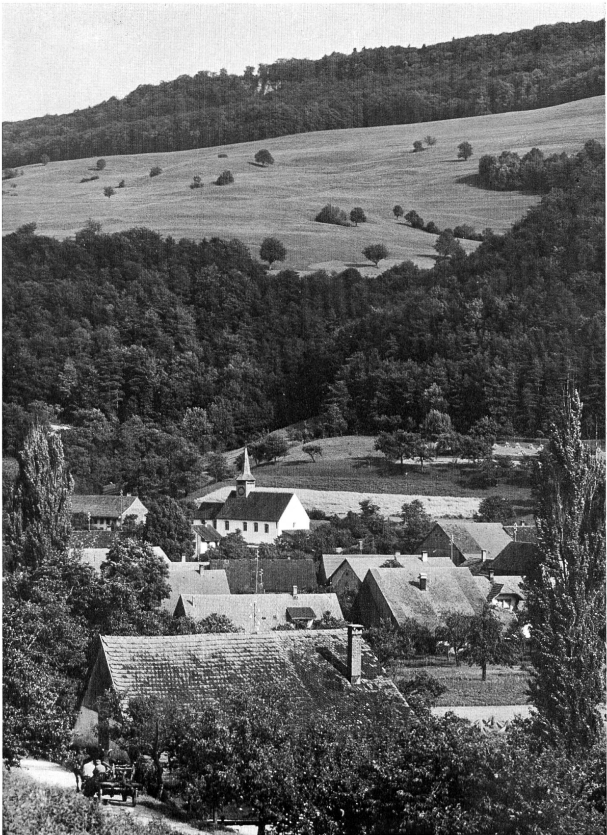
Thalheim. — Pfarrkirche. Nach der Restaurierung 1956/57