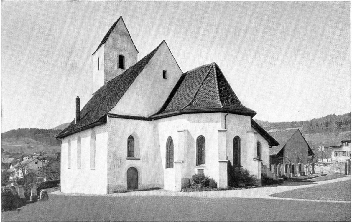
Auenstein. — Pfarrkirche von Südosten. (Außenrestauraton 1943)