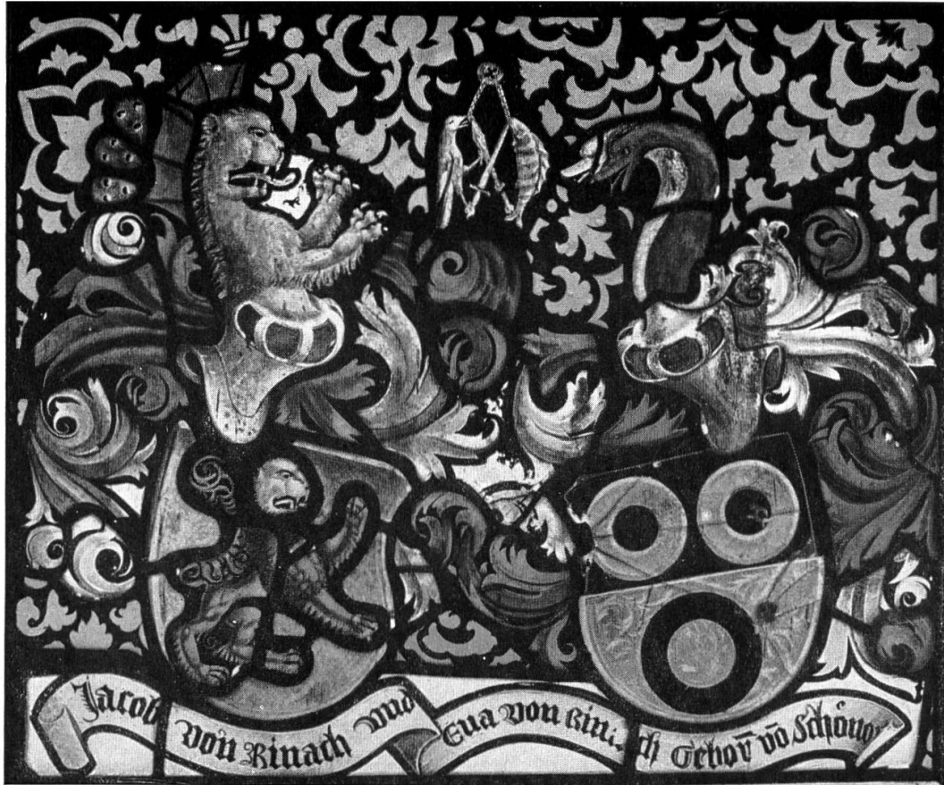
Auenstein. — Pfarrkirche. Wappenscheibe Rinach-Schönau. Um 1500