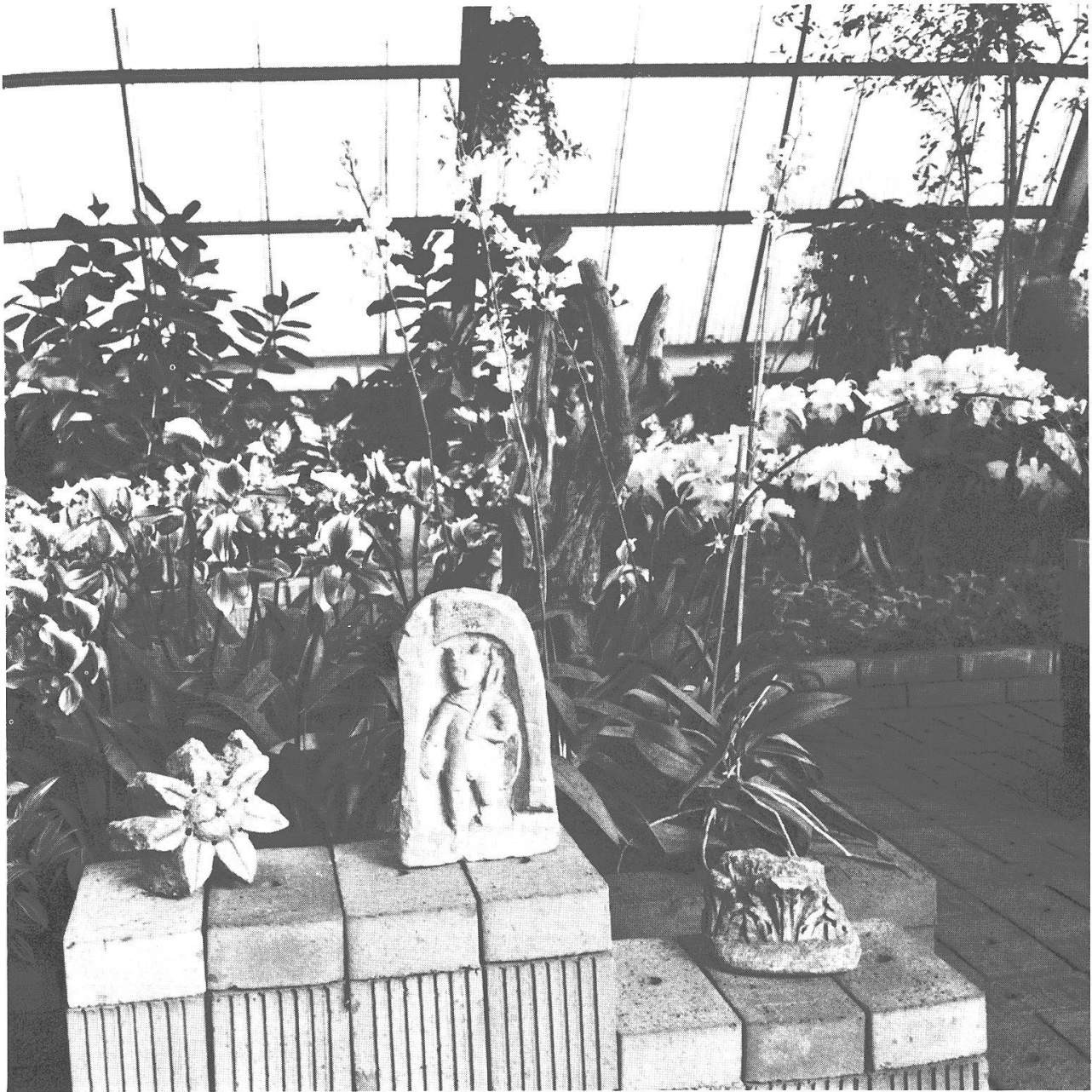
75-jähriges Jubiläum der Gärtnerei Haller, Brugg (4. – 19. November 1972). Grosse Jubiläums-Blumenschau in der Gärtnerei in Rüfenach. Sie wurde durch Objekte aus dem Vindonissa-Museum bereichert, da die Gesellschaft Pro Vindonissa dieses Jahr ein doppeltes Jubiläum feierte: sie wurde vor 75 Jahren gegründet und das Vindonissa-Museum vor 60 Jahren; zugleich stellte Eduard Spörri frühe Plastiken aus. Die Foto zeigt zwischen einer Blumenrosette und einem Kapitellfragment einen römischen Merkur provincialischer Herkunft.