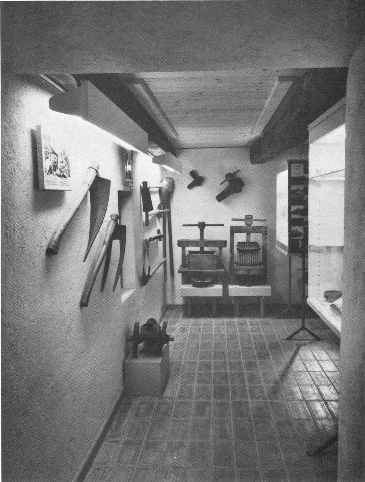
Heimatmuseum Schinznach Dorf — Durchgang zur Abteilung Weinbau