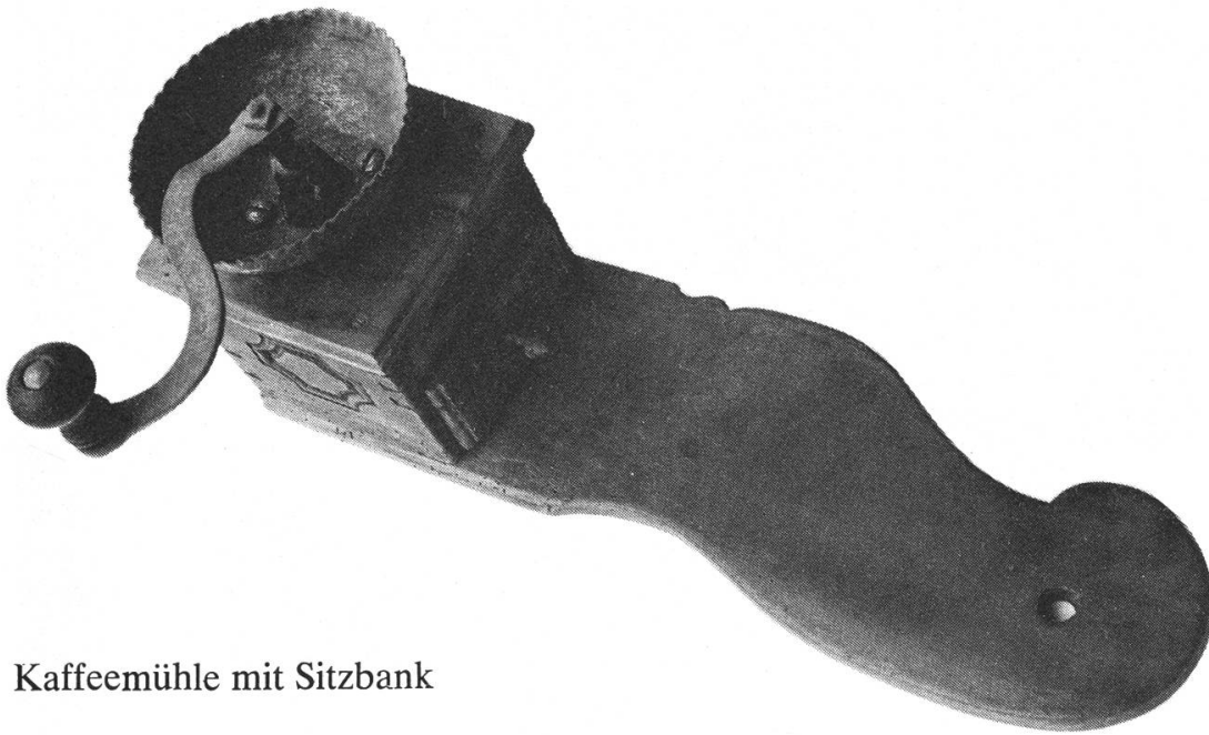
Kaffeemühle mit Sitzbank