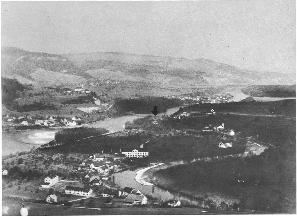
Blick vom Gebenstorfer Horn auf die Einmündung der Limmat in die Aare. Der Pfeil verweist auf Haggenschmids Villa auf der Limmatau. (Reproduktion einer Foto der aargauischen Denkmalpflege, abgedruckt im Fotoband «Der Aargau einst» von Theo Elsasser.)