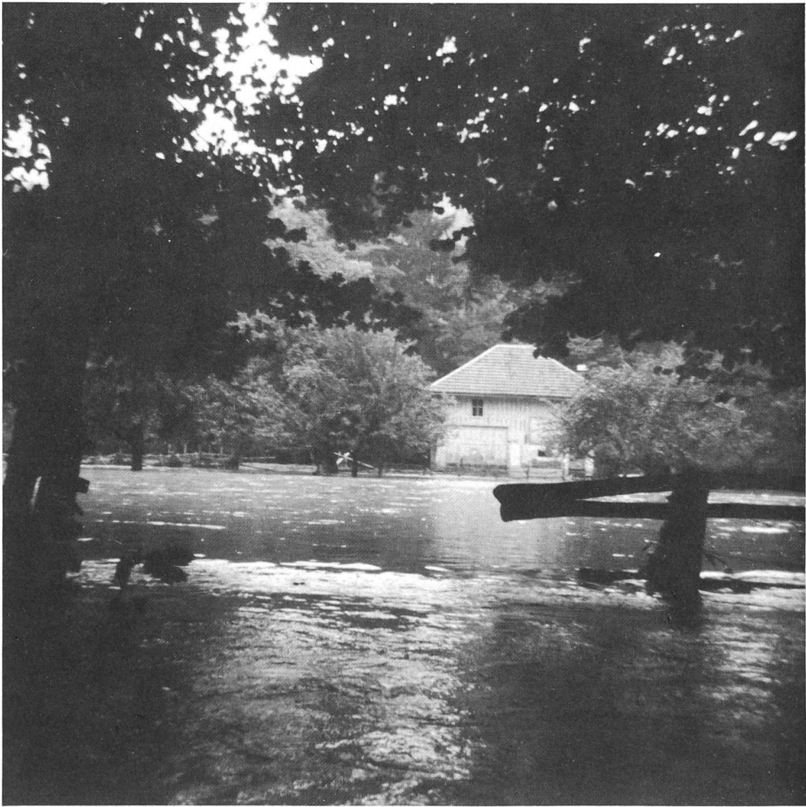
Die völlig überschwemmte Limmatinsel anlässlich des Hochwassers vom 8. August 1978. Im Hintergrund die Scheune Haggemachers.