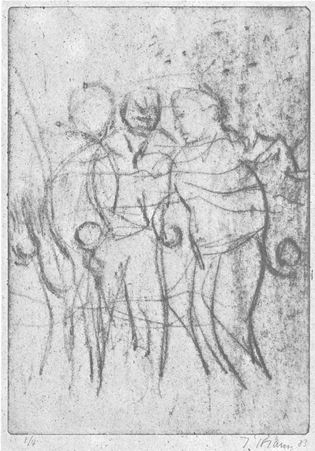
Joueurs de boules