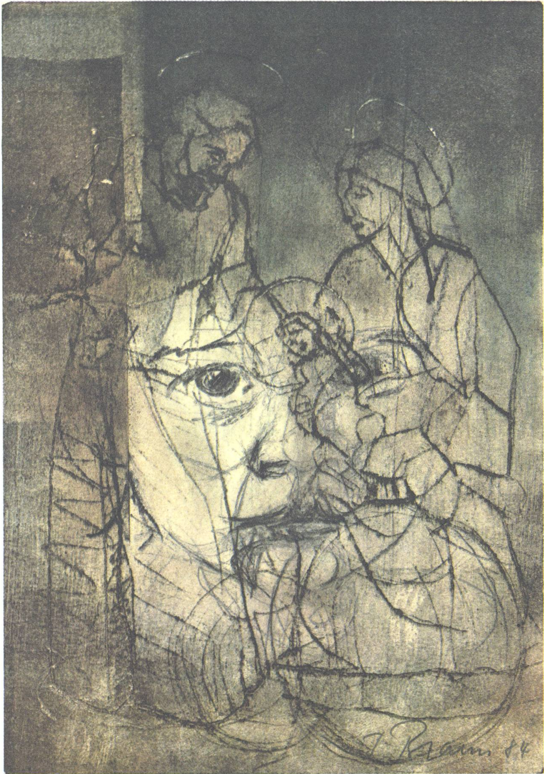
Licht in der Finsternis