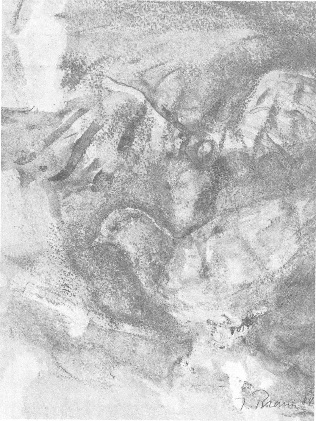
Brücke zwischen Himmel und Erde