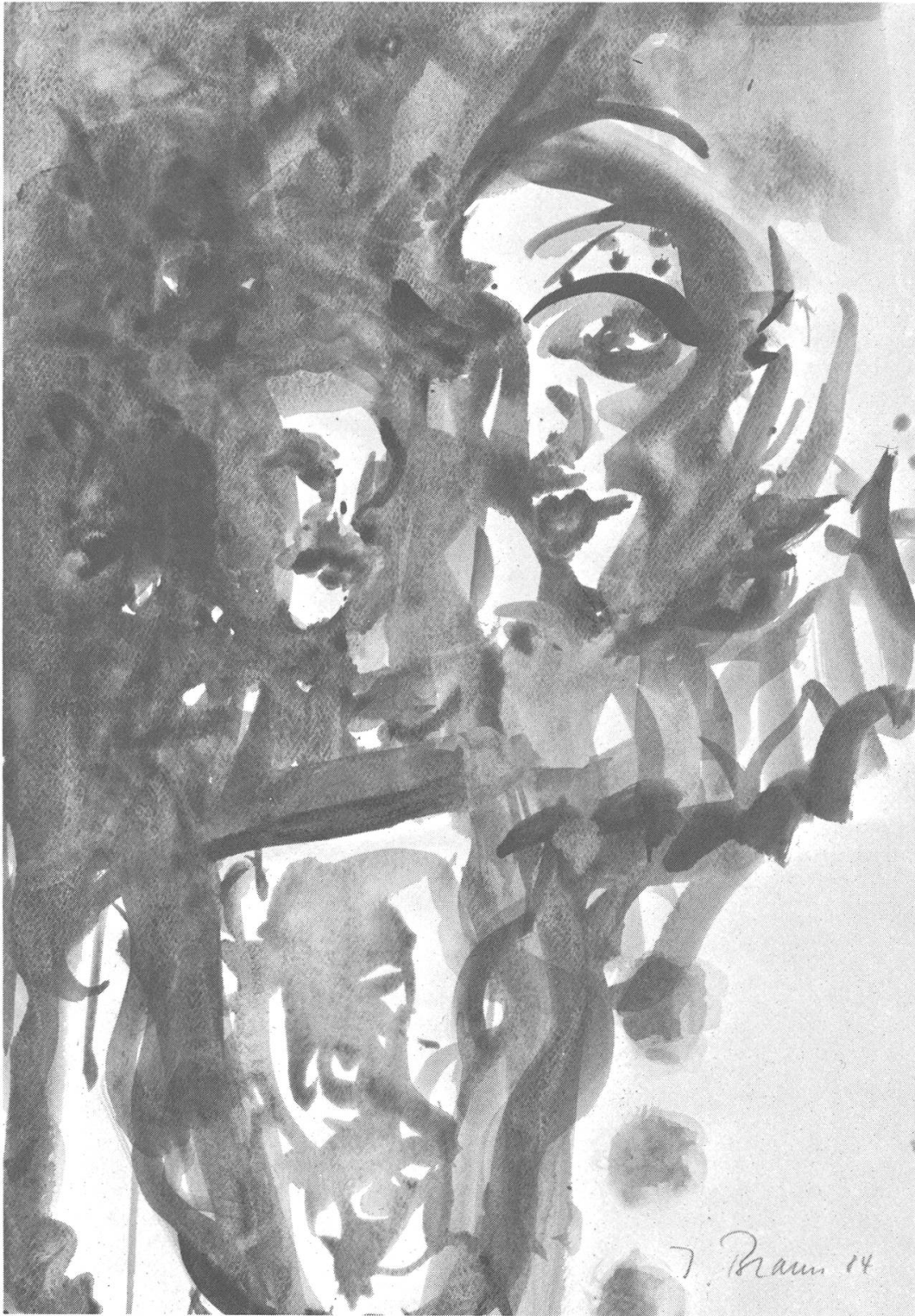
Das Jetzt vergessen