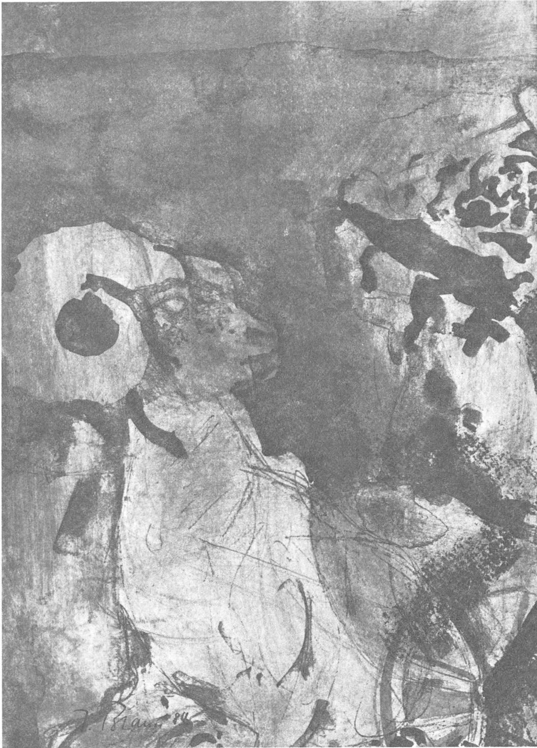
Donar, Herr der Blitze