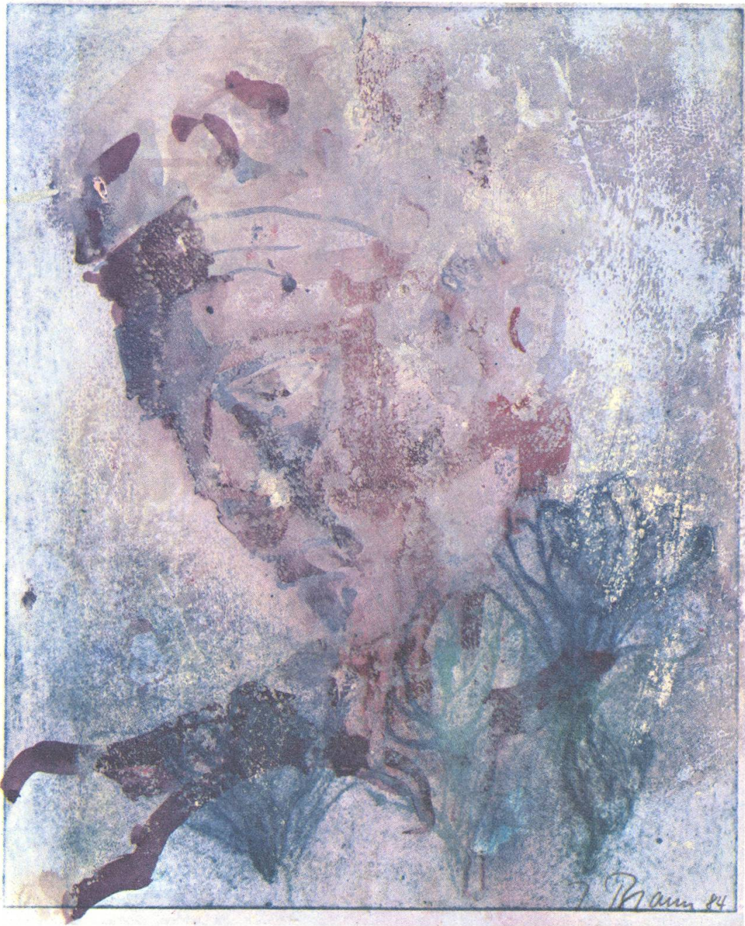
König Winter stirbt