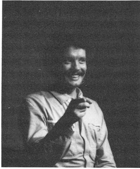
Impressionen aus dem Kulturleben im Bären Veltheim.