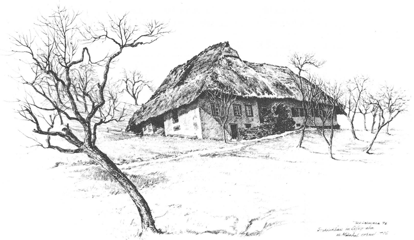
Strohdachhaus im Löffelgraben in Mönthal