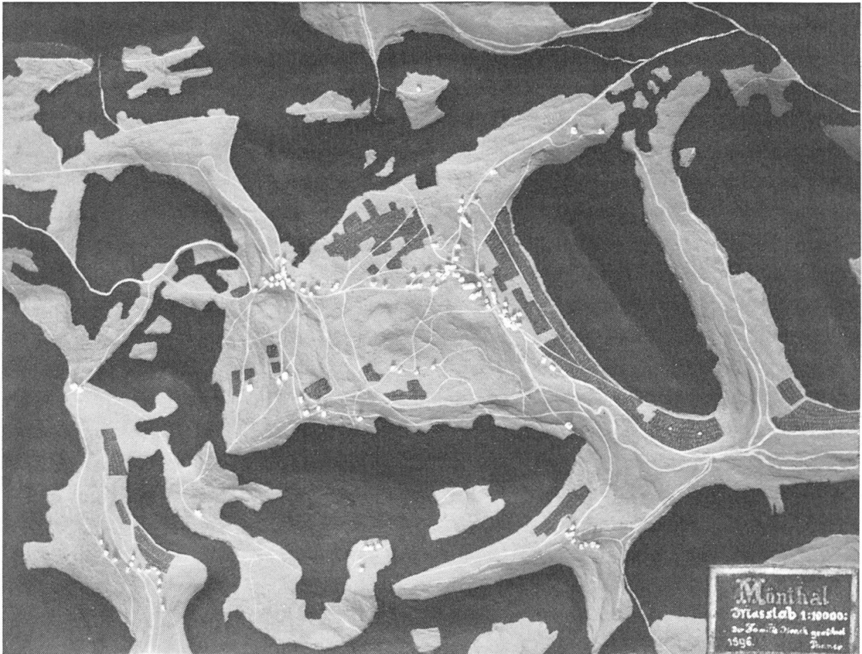
Das restaurierte Relief.