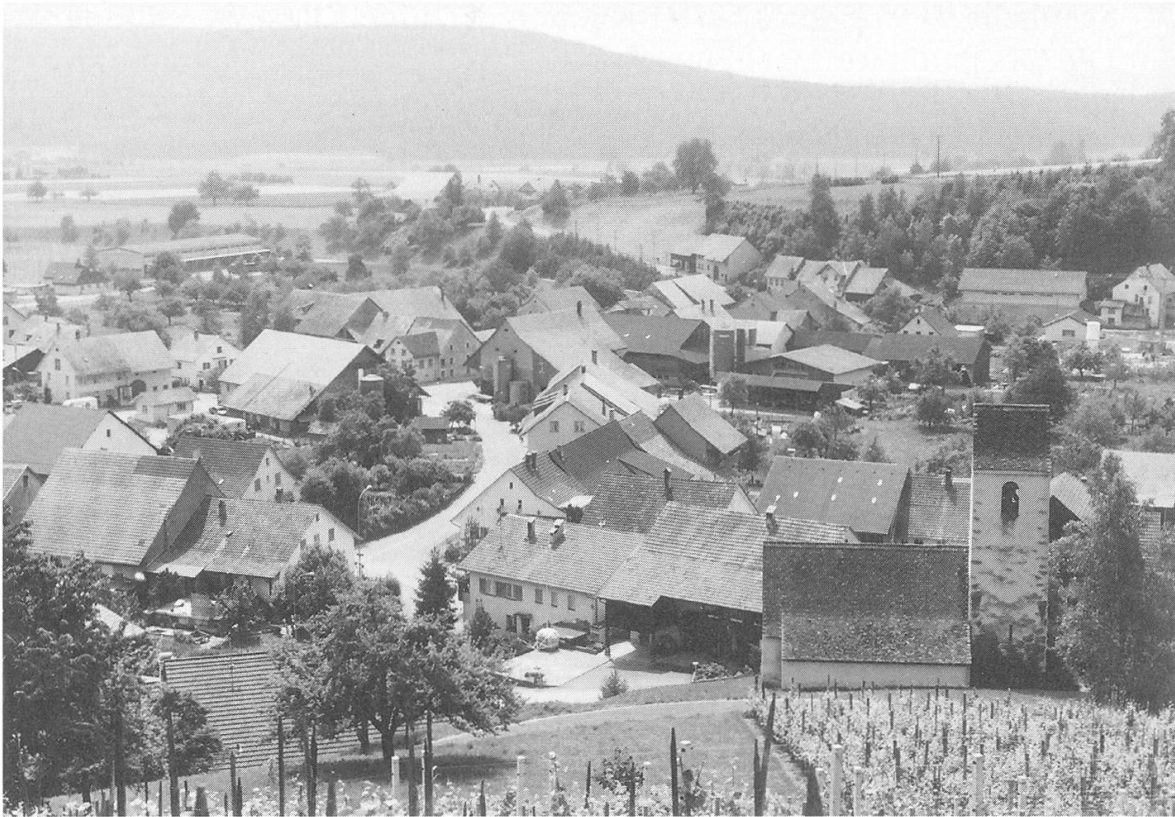
Blick vom Horn über das Unterdorf mit alten, intakten Häuserzeilen (1983).

ausgesiedelt. 1990 wurden von insgesamt 34 Bauernhöfen noch 10 hauptamtlich geführt.