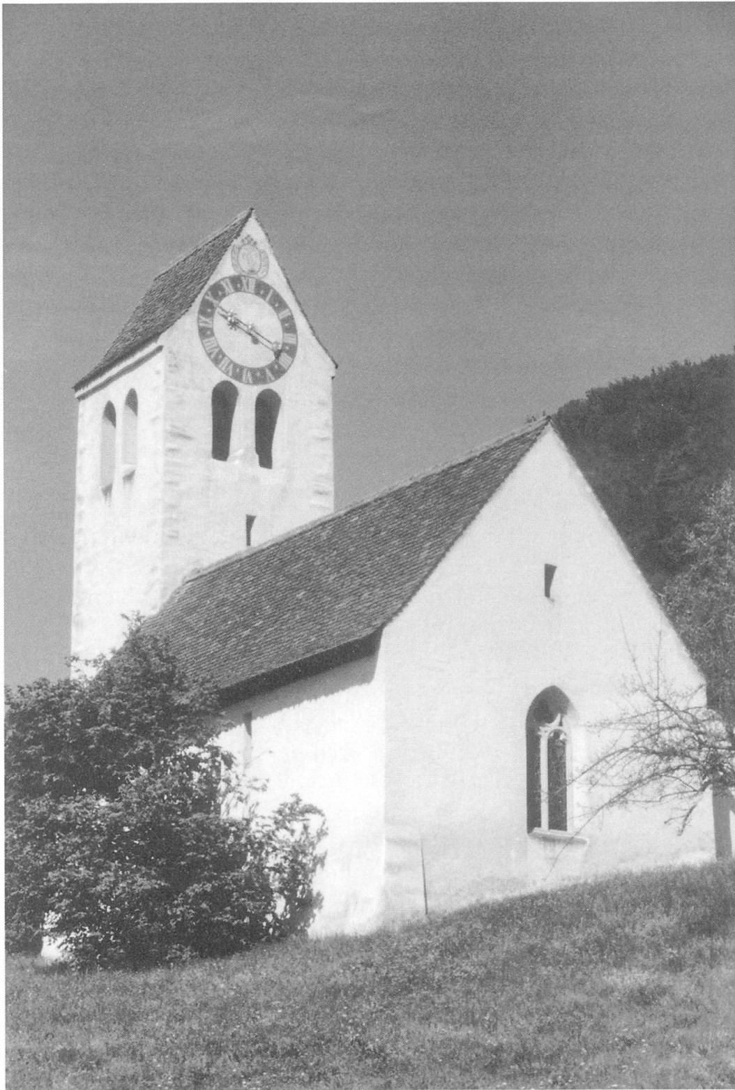
Die Kirche Sankt Peter (1981).