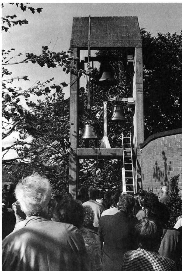
MAI 1995 – Das Zentrum Lee in Riniken erhält die dritte Glocke.