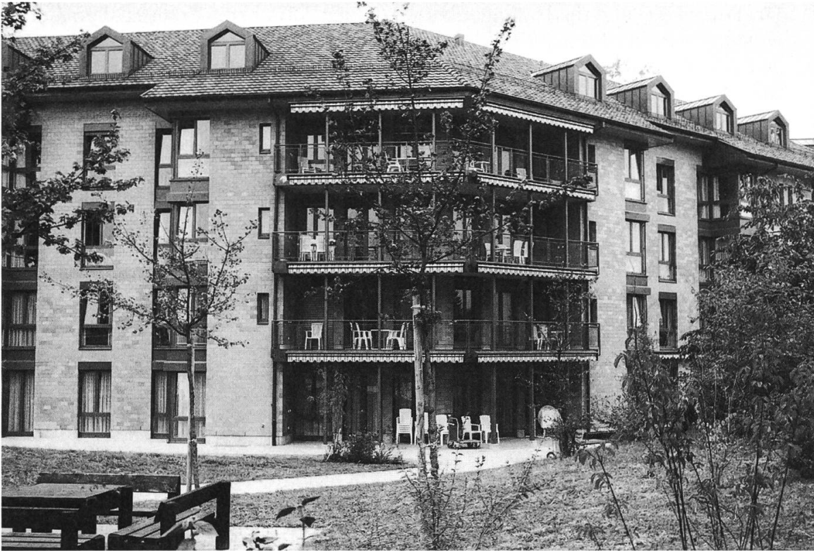
APRIL 1995 – Das neu erstellte «Krankenheim am Süssbach» wird bezogen.