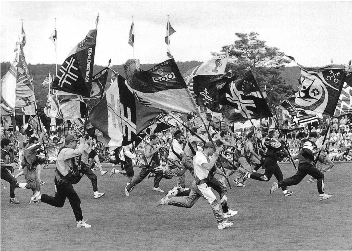
JUNI 1995 – Regionaltturnfest in Brugg-Windisch – Eines der drei Treffen im Aargau, das die Turnerschar auf das Eidgenössische Turnfest 1996 vorbereitet.