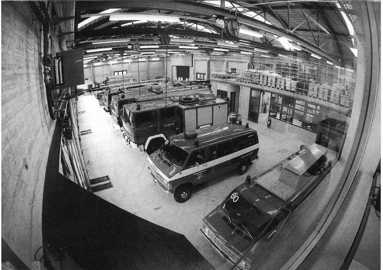
MAI 1995 – Die Stützpunktfeuerwehr Brugg und das Bauamt der Stadt Brugg beziehen das neu erstellte Magazin am Stahlrain.