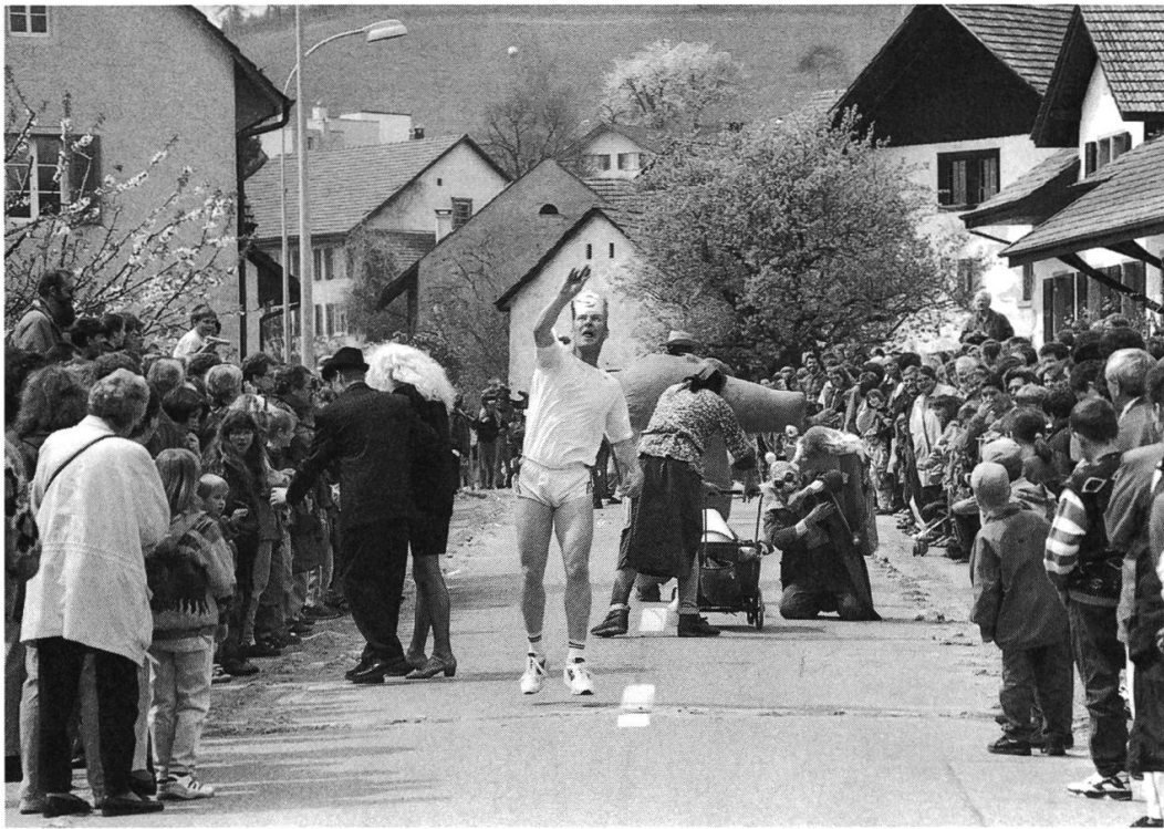
APRIL 1995 – Eierlesen in Auenstein. Die den Frühling symbolisierenden Eieraufleser gewinnen nach 66 Minuten. Sie werfen die 160 Eier 20 Minuten bevor die Winterläufer von der Schinzbacher Bözenegg zurückkehren ins Tuch.