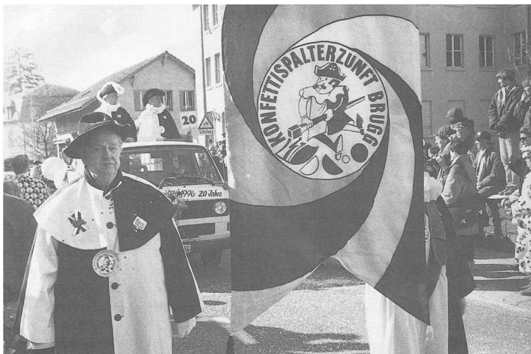
FEBRUAR 1996 – Die jubilierenden Konfettispalter führen den Fasnachts-umzug an.