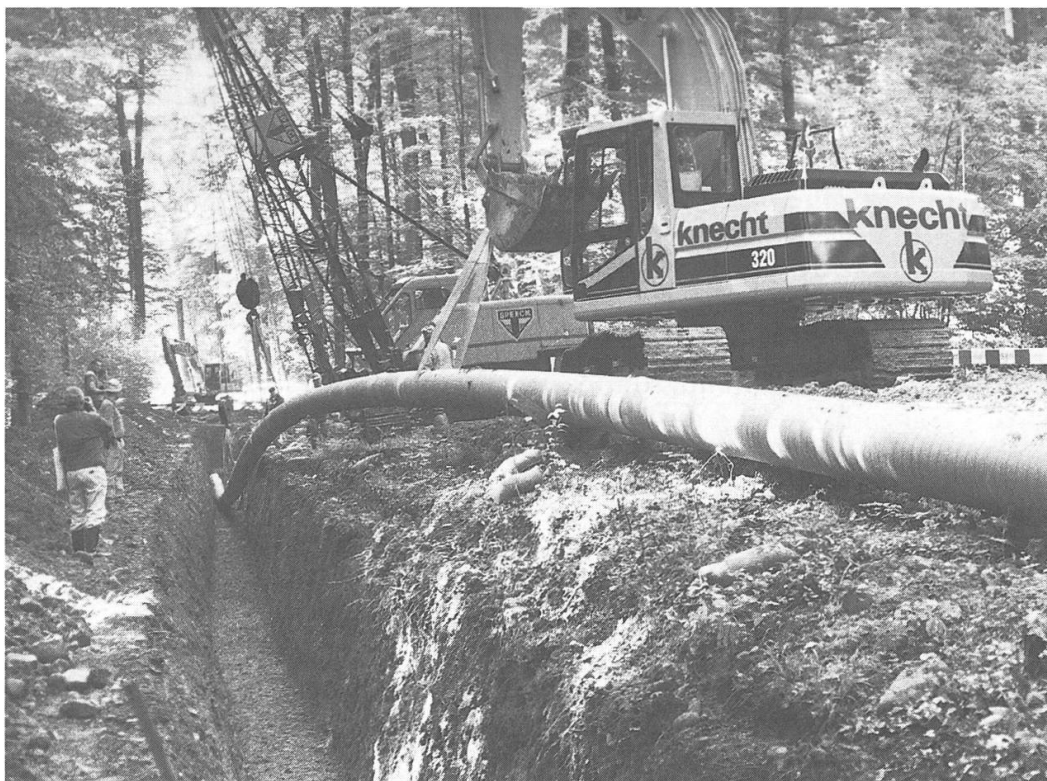
APRIL 1996 – Für das weltweit grösste, neue Gasturbinen-Prüfzentrum der ABB in Birr wird ein rund 120 m langes Teilstück der Gasleitung Othmarsingen–Birr in den vorbereiteten Graben gesenkt.

Türen gedenkt das Pestalozziheim des 250. Geburtstags des grossen Pädagogen. Brugg : Entgegen dem Antrag des Stadtrates entscheidet sich der Einwohnerrat zum Einbau einer umweltfreundlicheren, kombinierten Holzschnitzel/Gasheizung für die Schulanlage Au-Langmatt. Die reine Gasheizung verlangt einen Investitionsbedarf von 425 000 Franken, während die Kombiheizung mit rund 755 000 Franken zu Buche schlägt. – Ohne Gegenstimme bewilligt der Rat die Sanierung des Hallwyler-Schulhauses für 4,4 Millionen Franken. – Die Rechnung der Einwohnergemeinde schliesst mit einem Ertragsüberschuss von 2,63 Millionen Franken. Ebenso schliesst die Ortsbürgerrechnung mit einem Überschuss von 53 000 Franken. – In der Stellungnahme zum Richtplanentwurf fordert der Stadtrat einen Eintrag des Standortes Brugg als bestehende Bildungsstätte für Lehrer, einen besseren Schutz vor Überschwemmungen im Raum Wildschachen und Au-Schachen und die Fixierung eines Zughaltes im nationalen Schnellzugnetz. – Ab Montag, 11. März, ist die neue Eisenbahn-Aarebrücke wieder zweispurig befahrbar. – Mit einer schlichten Feier wird das mit einem Kostenaufwand von etwas mehr als drei Millionen Franken in zwei Etappen sanierte und im Raumangebot erweiterte Gebäude des re-