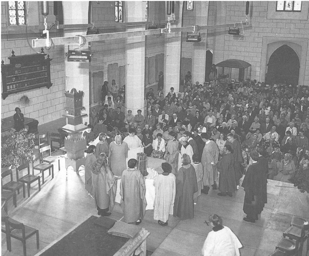
MAI 1996 – Der kantonale ökumenische Pfingstgottesdienst in Königsfelden dient der Begegnung Behinderter und Gesunder.