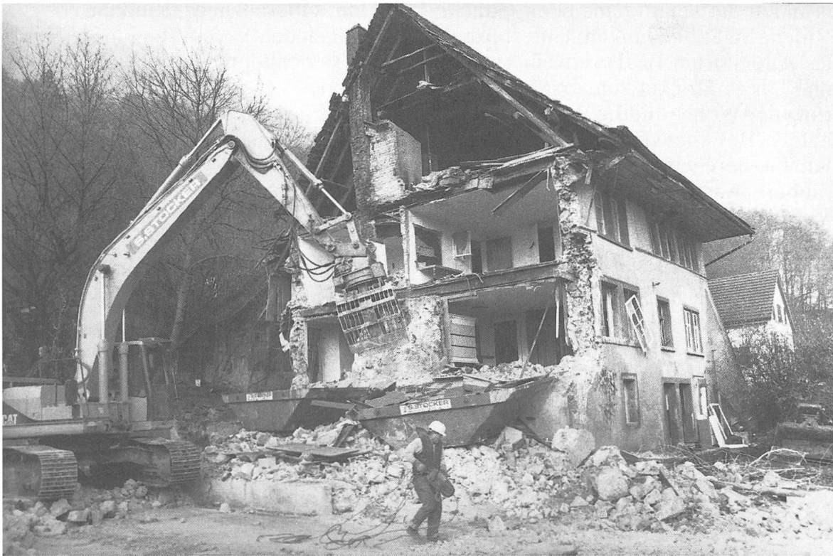
DEZEMBER 1995 – Mit dem Abbruch der einsturzgefährdeten alten Mühle an der Hohlgasse in Lauffohr verschwindet ein markantes Bauobjekt.