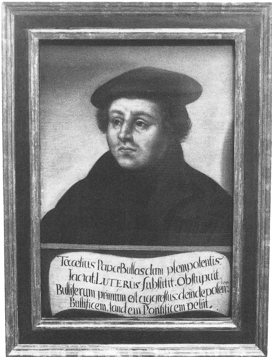
Martin Luther (1483–1546)