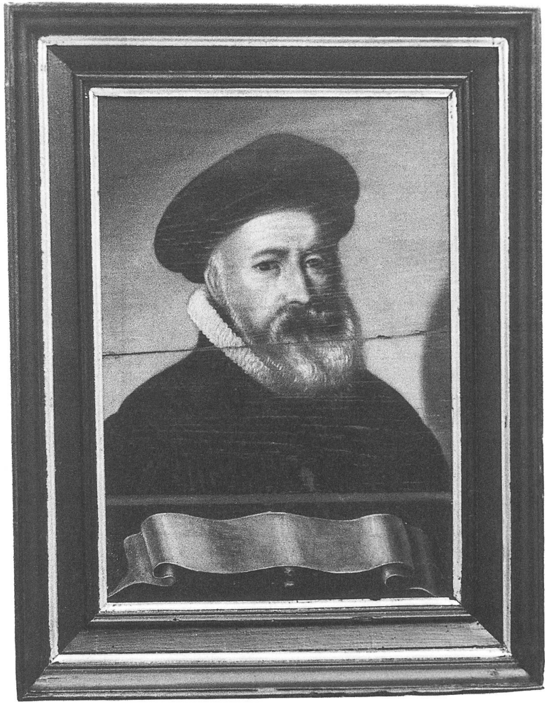
Stephanus Fabricius (1569–1648)