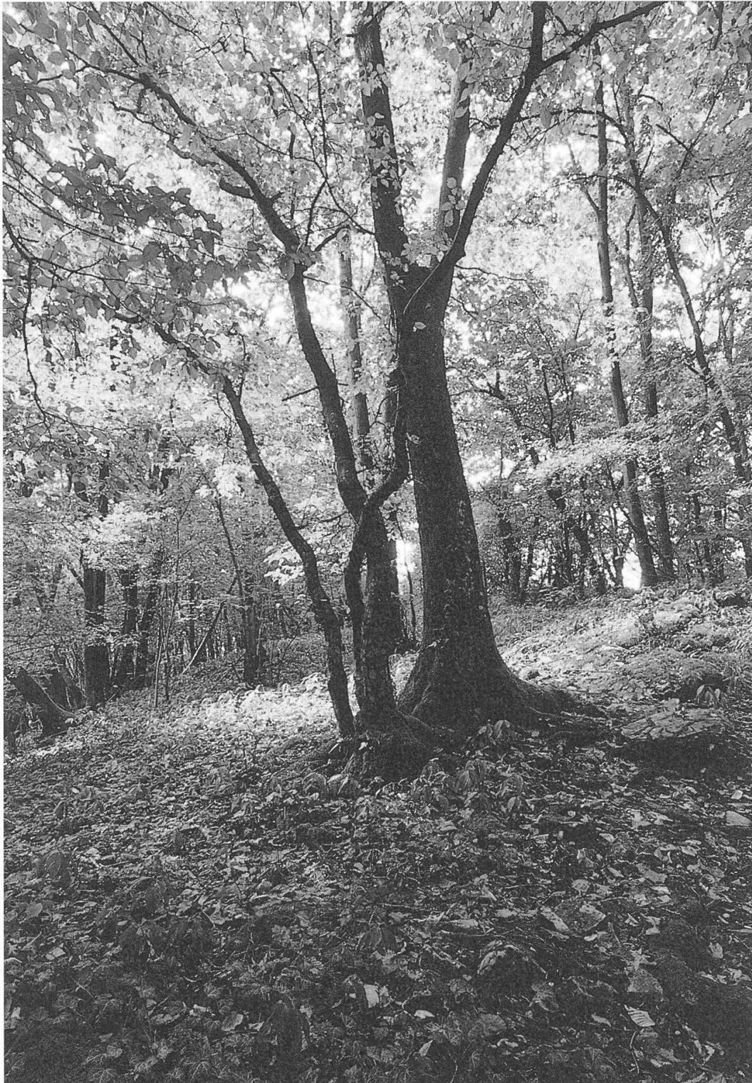
Waldvielfalt von schwachwüchsigem ehemaligem Niederwald mit typischen Stockausschlägen bis zu standortfremden, unterwuchslosen Fichtenaufforstungen