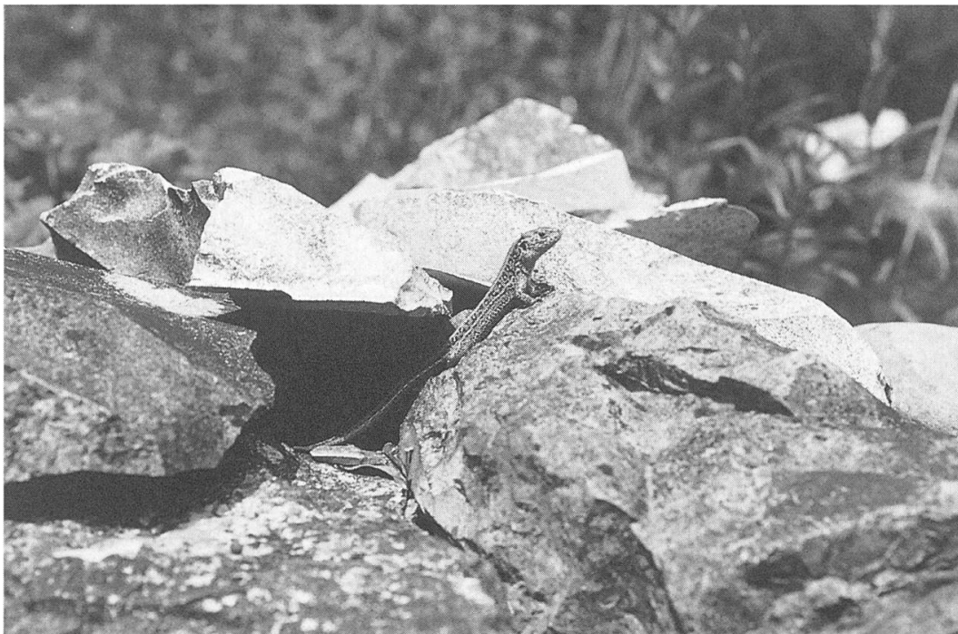
Sonnen- und Mauerliebhaber: Zauneidechse

Auf Insekten haben es jedoch auch andere blitzschnelle Jäger abgesehen: Reptilien. Im Reptilieninventar, das im ganzen Aargau in den Jahren 1987 bis 1990 erhoben wurde, sind am Eiteberg 5 Stellen mit Blindschleichen und Zauneidechsenvorkommen enthalten. Bereits dieses Inventar attestierte dem ganzen Lebensraum kantonale Be-