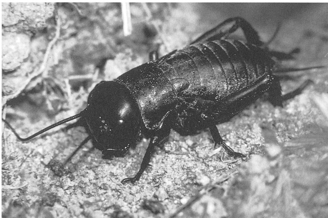
Sänger in Magerwiesen: Feldgrille

Die riesige Zahl der Insekten, Spinnen und übrigen Kleintiere deckt den Tisch reichlich für Vögel. Insgesamt sind 45 Arten nachgewiesen, die am Eiteberg brüten. Neben weitverbreiteten Allerweltsarten auch anspruchsvollere, wie z.B. die Goldammer oder der Neuntöter. Beide sind charakteristisch für reichstrukturierte Heckenlandschaften. Besonders der Neuntöter ist zudem angewiesen auf Wiesen mit Grossinsekten wie Heuschrecken, Grillen, Schmetter-