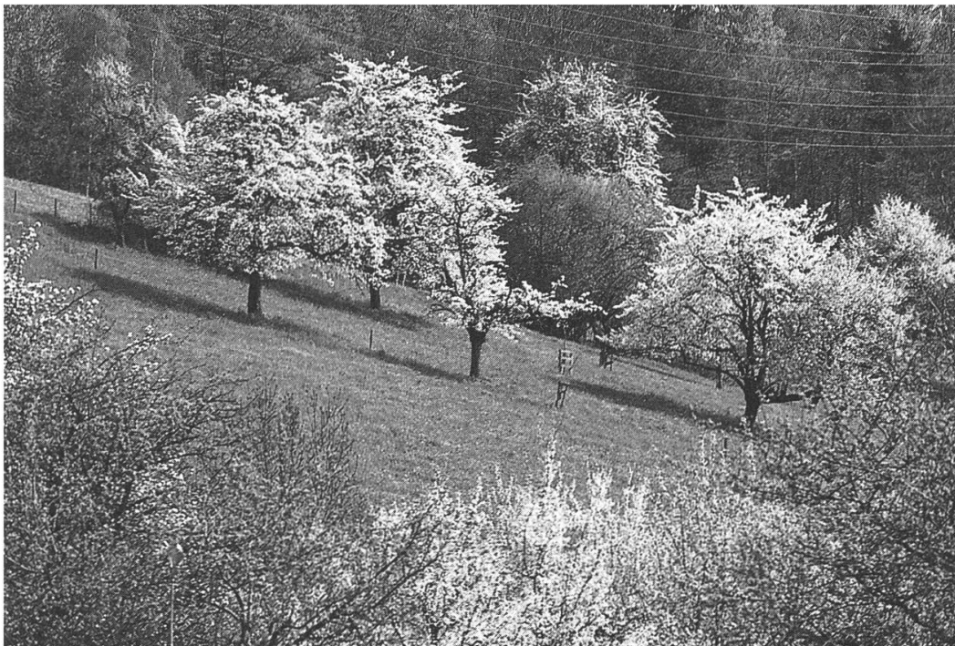
Reich strukturiert mit Gehölzen: Eitebergsüdhang

Am Hangfuss erhält der überalterte und gelichtete Hochstamm-Restbestand seit 1995 jährlich Zuwachs durch neue Bäume (alte Sorten), für die der Natur- und Vogelschutzverein Lupfig Patenschaften