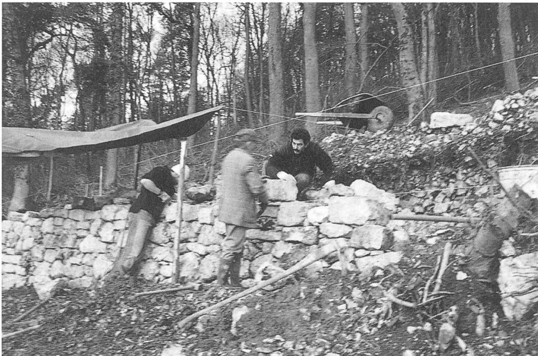
Aufbauarbeit am historischen Weg