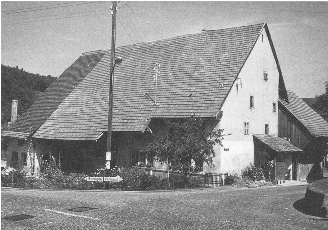
Das Märkihaus vor dem Abbruch des strassenseitigen Hausteils und vor der Renovation.