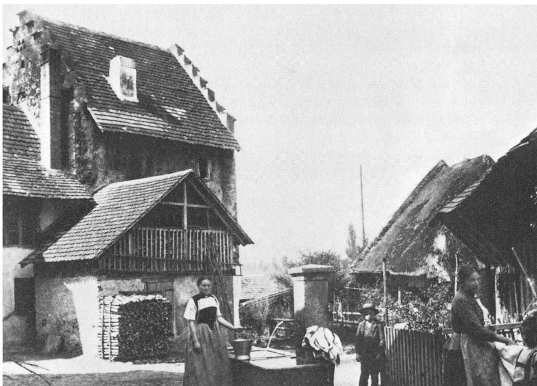
Dorfpertie beim Schlösschen Altenburg

Die Saison der Sommerfeste beginnt am 1. Juli mit dem Windischer Jugendfest. Das folgende Wochenende gehört den Musikvereinen aus der ganzen Schweiz. Sie messen sich von Samstag bis Montag anlässlich des Eidgenössischen Musikfestes in Aarau. Am Donnerstag darauf findet der Rutenzug in Brugg statt, und wenige Tage später steht die Prophetenstadt im Banne des Chorgesangs. 13 Verbands- und drei Gastchöre haben sich für das Bezirksgesangfest angemeldet.