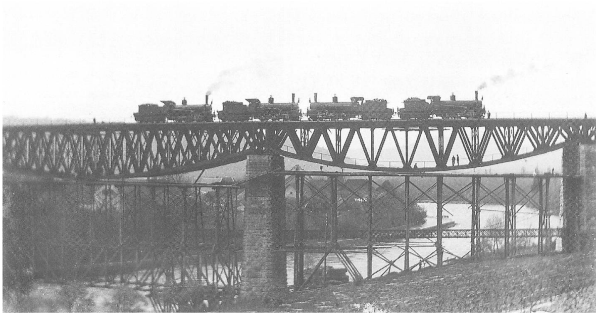
Die Belastungsprobe für die neue Eisenbahnbrücke gelingt. (vgl. «Brugger Neujaarsblätter» 106 (1996) 111–132)

setzt: Vier Lokomotiven zu je 65 Tonnen fahren in drei verschiedenen Geschwindigkeiten über die Brücke. Diese hält der Belastung stand, denn «die maximale Moment-Senkung der Brücke beträgt 1 bis 1,5 cm, die bleibende Senkung 1 bis 2 mm». Weniger Erfreuliches wird wiederum vom Simplontunnel berichtet. Schlechtes Gestein zwingt die Bauleitung, jede Öffnung auszumauern. Man hofft trotzdem, den Durchbruch bis Ende Jahr zu schaffen.