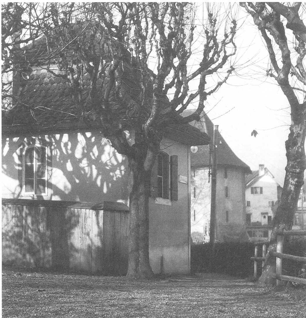
Blick von der Brugger Promenade auf Pavillon und Salzhaus.

Den ganzen Januar und Februar über herrscht klirrende Kälte. Diese und eine Menge Schnee beeinträchtigen zwar den Verkehr, schaffen umgekehrt aber ideale Schlittverhältnisse. Zum Bedauern von Gross und Klein erlässt der Kreisingenieur plötzlich ein Verbot: «Das Schlitten auf allen Landes- und Ortsverbindungsstrassen ist strengstens untersagt!» Die rigorose Massnahme war auf Klage einer Frau von Umiken und als Folge diverser Unfälle beschlossen worden. Heftige Einsprachen von Gemeinden und Schulpflegen bewirken schliesslich, dass das «Schlittverbot» aufgehoben wird und sich Kinder und Erwachsene auf den Wegen neben den grossen Verbindungsstrassen wieder vergnügen können: Denn «es