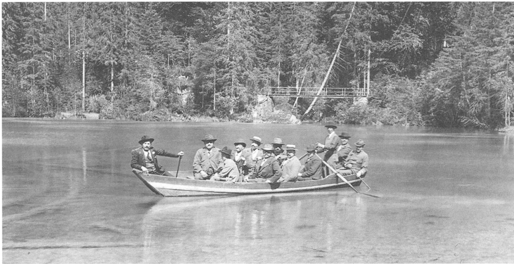
Der Männerchor Frohsinn bei seinem Vereinsausflug zum Blausee.