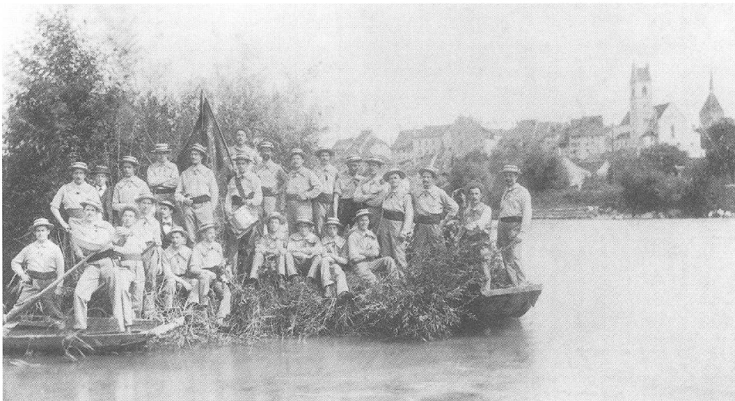
Die Brugger Pontoniere erringen am Eidgenössischen in Aarau den 5. Rang.