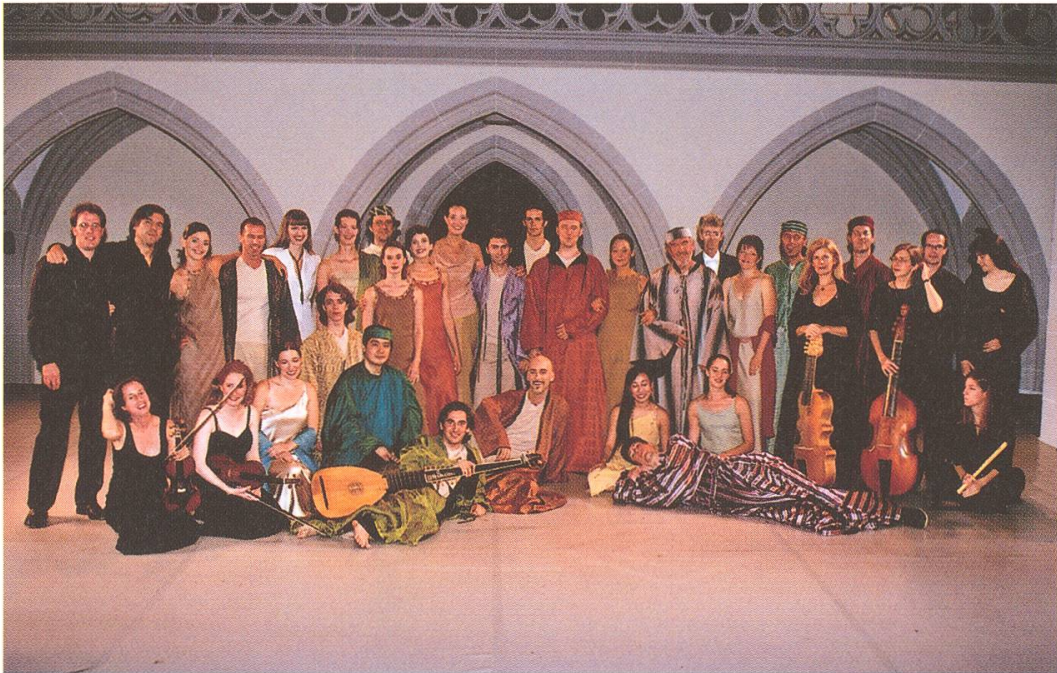
Nach verklungenem Schlussapplaus: das Erinnerungsbild mit allen Mitgliedern des Ensembles

Als am 4. September der Vorhang über ein weiteres – das mittlerweile achte – Königsfelder Festspiel fällt, steht fest: Über 5000 Menschen haben die «Königin von Saba» gesehen. Das ist ein neuer Rekord. Und aus der Finanzabteilung kommen erste Zeichen der Entwarnung: Zumindest eine schwarze Null wird man auch diesmal schreiben.