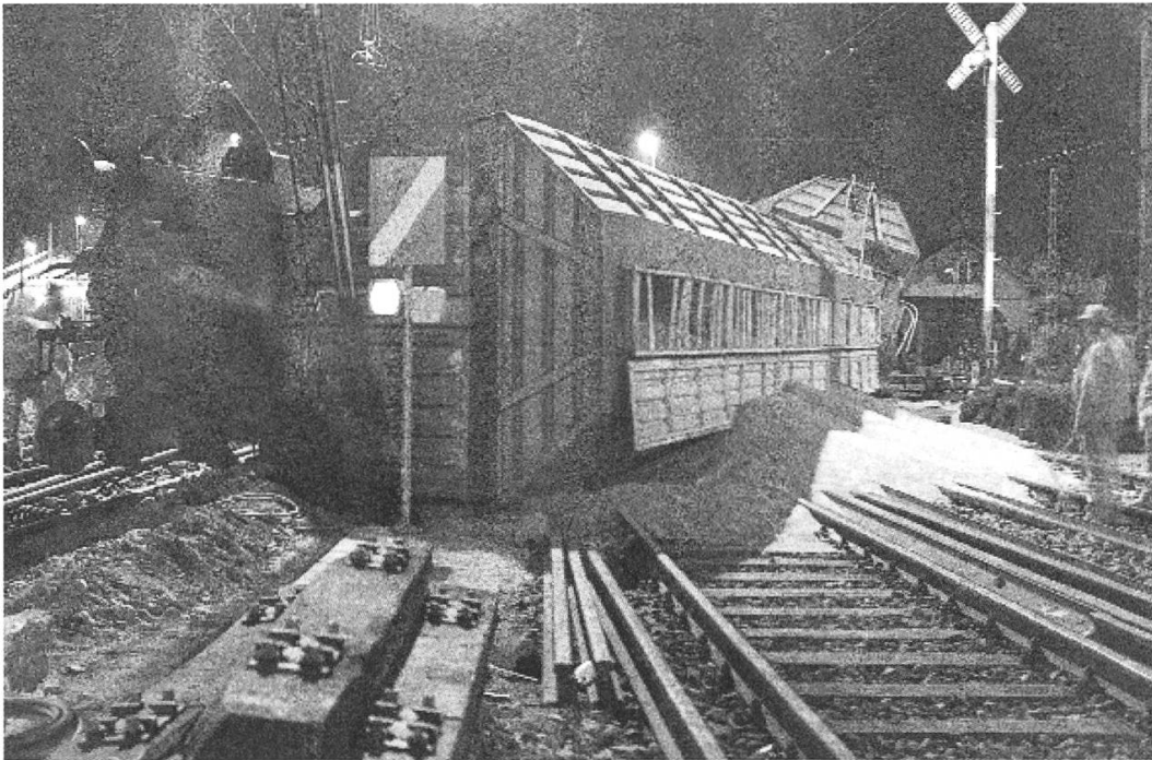
Der 1978 umgekippte Silowagen mit dem ausgelaufenen Weizen.