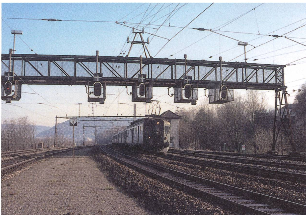
Die Signalbrücke Seite Ausfahrt Turgi (abgebrochen 2005). Bei den SBB sind von diesen nur noch wenige vorhanden. Im Hintergrund das Stellwerk 1.

les ausgebaut und umstrukturiert ist, selber unter Druck, jedenfalls für Personal und Verwaltung. Brugg ist nur noch eine regionale Dienststelle ohne Bahnhofinspektor; es ist sogar geplant, Brugg fernzusteuern. Ab dem Fahrplanwechsel vom 12. Dezember 2004 musste für einen Teil des Personals eine neue Lösung gefunden werden. Aus technischen Gründen bleiben die Arbeitsplätze in der Fernsteuerung für die nächsten Jahre noch erhalten; dies ist ein Glücksfall für rund 14 Personen. Dann aber ist geplant, Brugg am RCC (Rail Control Center) in Olten anzuschliessen; doch das dürfte noch einige Zeit dauern. Administrativ ist die Verwaltung des gesamten Personals heute je nach Dienststelle unter Olten, Basel, Luzern und Zürich aufgeteilt, was sich ab und zu nicht unbedingt positiv auf die Entscheidungswege auswirkt.