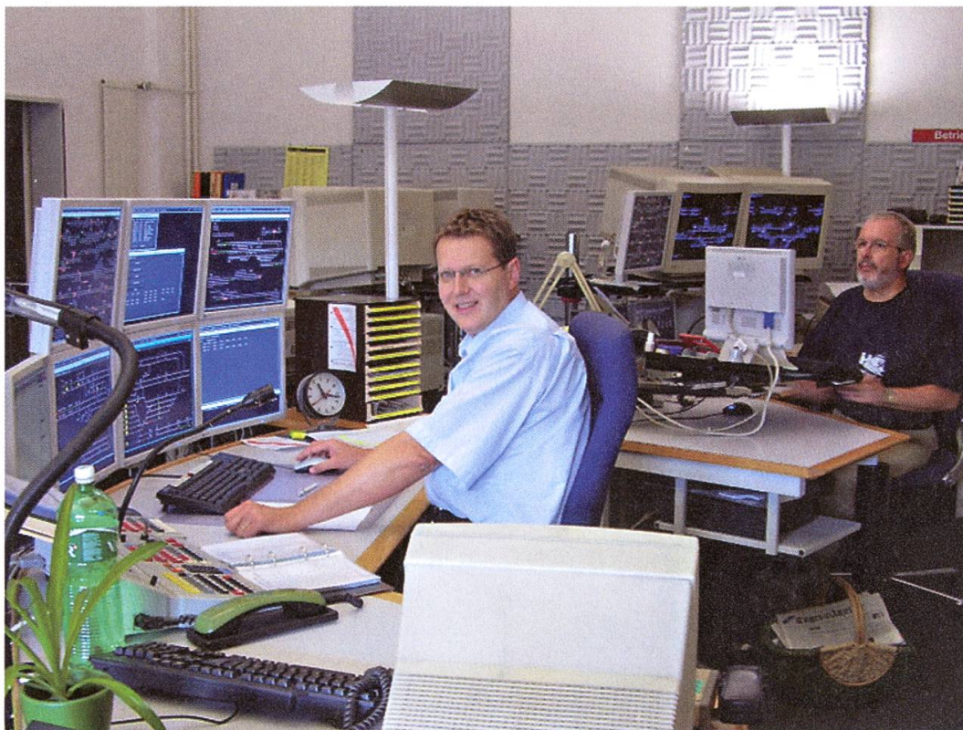
Das neue Fernsteuerzentrum mit vier Arbeitsplätzen und einem Reserveplatz (Aufnahme 2005).

Regionalzentrum für ein grosses Gebiet der Nordwestschweiz ernannt wurde. 1996 waren dieser Leitstelle 136 Mitarbeitende zugeteilt. Zählte man die 170 Mitarbeitenden der übrigen Betriebe dazu, fanden 300 Leute ihre Arbeit hier bei der Bahn.