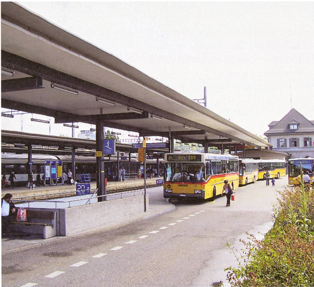
Der moderne Bahnhof mit Busstation und verlängertem Perrondach (Aufnahme 2005).