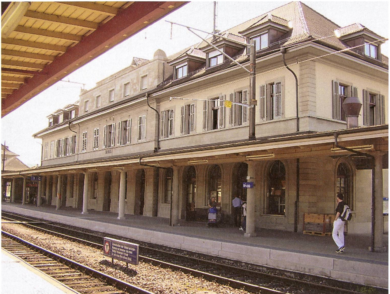
Gleisseitige Ansicht des Aufnahmegebäudes in Brugg (Aufnahme 2005). Das Befehlswerk auf Perron 1 wurde entfernt zu Gunsten eines freien Durchgangs für das Publikum. Zwei neue runde Trag-säulen mussten angefertigt werden; sie befinden sich in der Mitte, sind heller und daher deutlich zu erkennen.

Wärme als der vormalige graue Anstrich, der alle Konturen und Ornamente hatte verschwinden lassen.