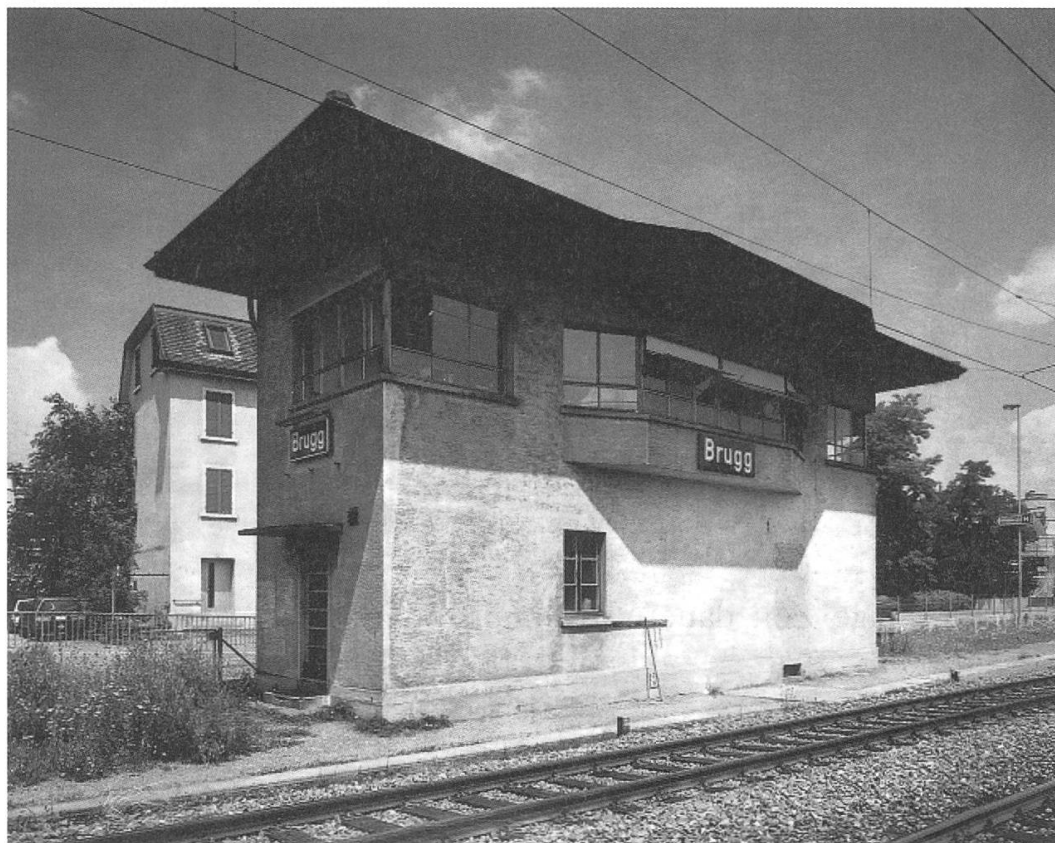
Das Stellwerk 2 an der Aarauerstrasse, ein typischer Bau mit auskragendem Arbeitsraum (abgebrochen 2005).

Mit der Beseitigung der letzten Einspurinsel auf der Nord-Südachse zwischen Brugg und Othmarsingen wurde der «Laubsägelbahnhof» Birrfeld eliminiert; es entstand der neue Bahnhof Lupfig. Die Eröffnung der durchgehenden Doppelspurlinie am 29. Mai 1994 erlaubt neu eine Banalisierung (wechselseitiger Fahrbetrieb) auf der ganzen Südbahn. Letztlich kam der Bahnbetrieb Brugg jetzt, wo al-