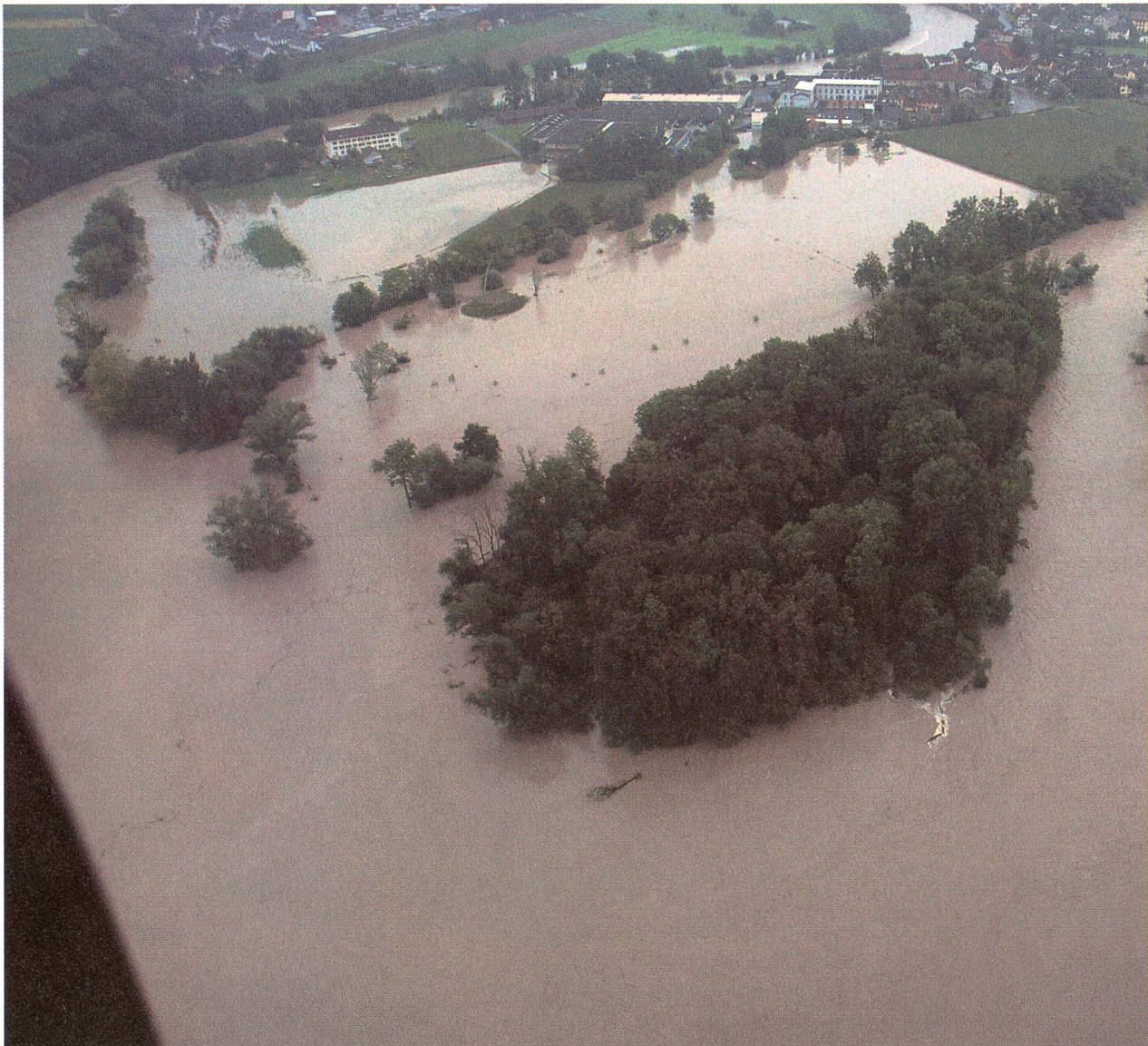
Hochwasser im Limmatspitz, Blickrichtung Süden.

mit einem Hochwasser. Überaus starke Niederschläge am Wochenende vom 20./21. August in den Voralpen der Zentralschweiz liessen zuerst Reuss und dann Aare stark anschwellen. Wegen der kleinen Emme aus dem Entlebuch führte die Reuss am Montag ein bisher noch nie gemessenes Rekordhochwasser. Dank der ausgleichenden Wirkung des Thuner- und Bielersees erreichte die Aare erst etwas später die höchste Marke, blieb jedoch unter dem Stand von 1999. Daher lag der Pegel nach der Mündung von Reuss und Limmat mit 2450 Kubikmetern in der Sekunde doch etwas tiefer. Das neue Auen-