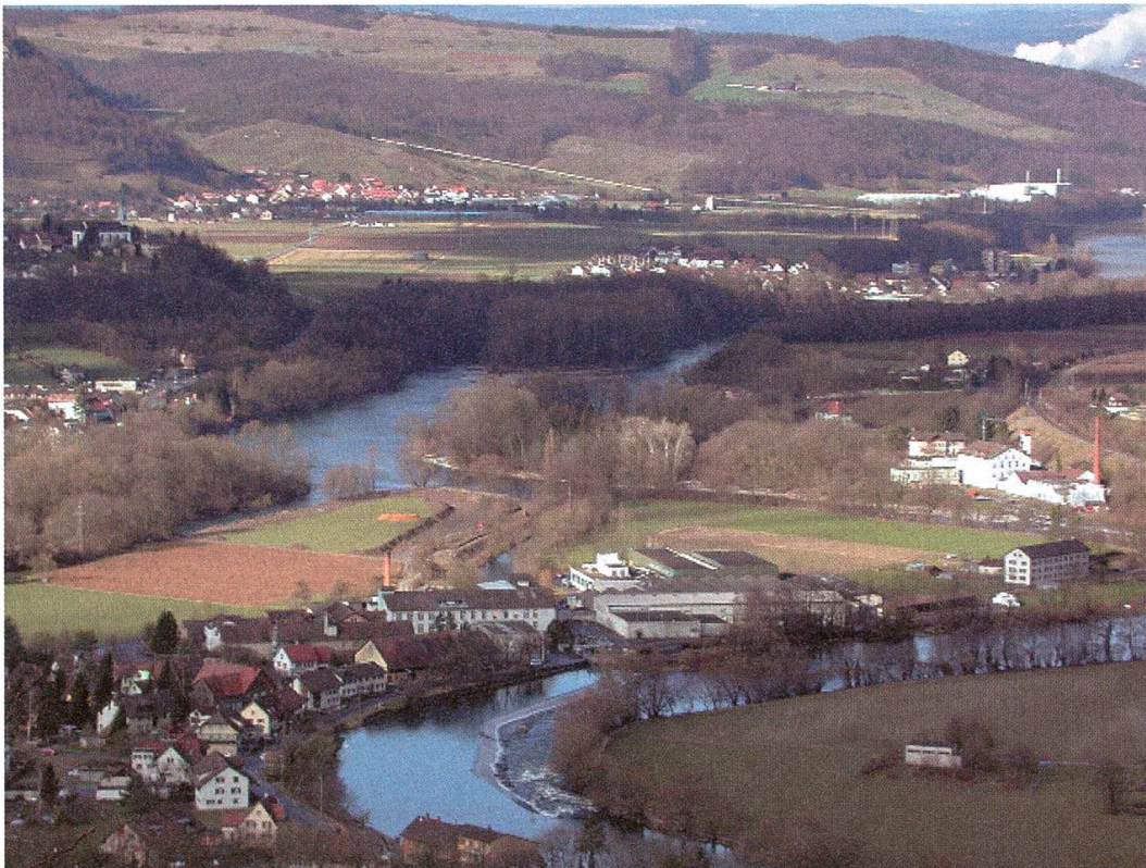
Sicht vom Gebenstorferhorn.

Der Zusammenfluss von Aare, Reuss und Limmat bildet das aargauische Dreistromland: das Wasserschloss. Kurz nach dem markanten Engpass von Brugg vereinigt sich die Reuss mit der Aare. Im Mündungsgebiet ist gut sichtbar, wie die Reuss von der meist grösseren Aare richtiggehend in die Hangkante des Gebenstorfer Hornes gedrückt wurde. Nur 700 Meter weiter flussabwärts stösst dann die Limmat dazu, welche flussgeografisch gesehen ebenfalls von rechts kommend sich zur Aare gesellt. Die zwischen Aare und Limmat liegende und zusammenlaufende Landzunge wird Limmatspitz