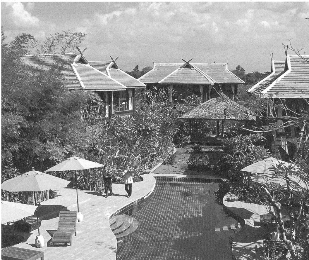
Ban Sabai SPA Village, Chiang Mai