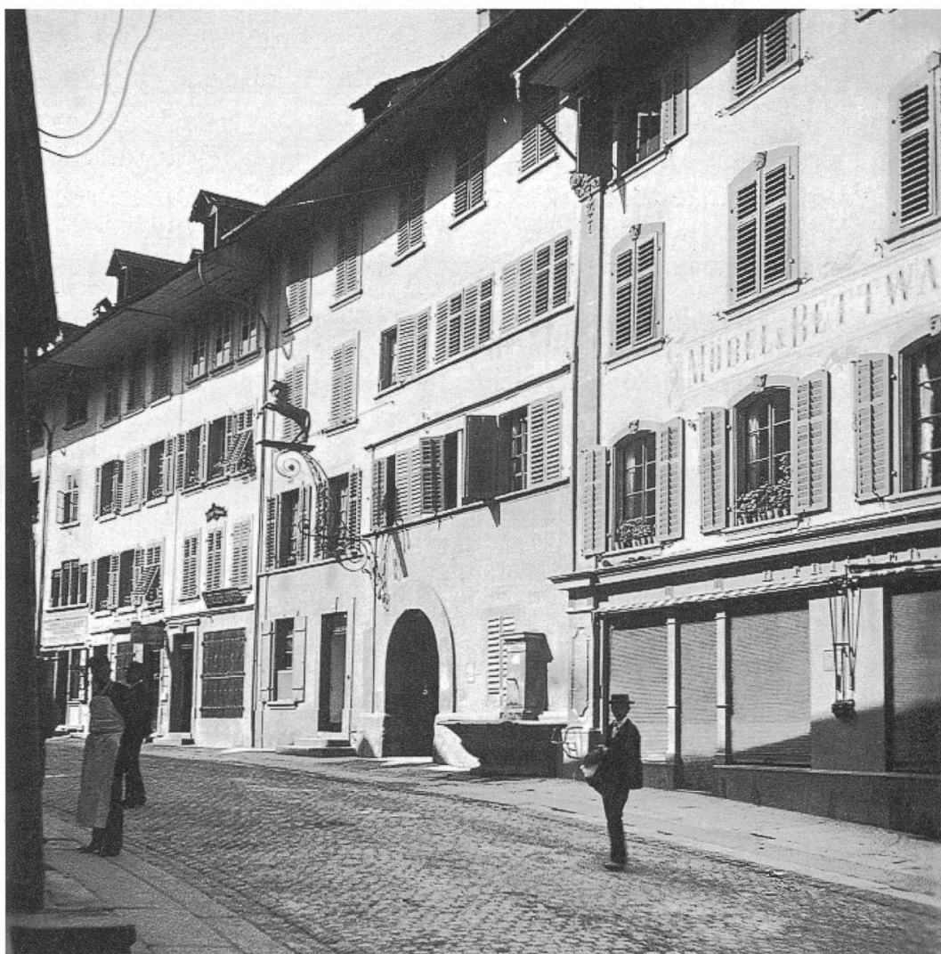
An der Brugger Hauptgasse: in der Mitte das einstige Gasthaus zum Rössli mit Einfahrt durch Rundbogen. An der Hausfassade ist noch das Wirtshausschild angebracht. Rechts das heutige Eckhaus Hauptstrasse/Kirchgasse.

So kam es, dass Jakob Schilplin 1786 das Gasthaus zum Rössli (heute Hauptstrasse 19) samt der an der Storchengasse stehenden Scheune (heutiges Restaurant «Rössli») für 4000 Gulden erwerben konnte. Er war damals seit zehn Jahren mit Jakobe Hagnauer aus Aarau verheiratet und erfreute sich zweier Buben und eines Mädchens. Während die Frau die Wirtschaft führte, verlegte er sich immer mehr auf Viehhandel und Fuhrhaltereie. Sein Pferdebestand wuchs; 1794 besass er deren 17 und damit ein Drittel aller Pferde von ganz Brugg. Für das Unterbringen der Wagen mietete er die