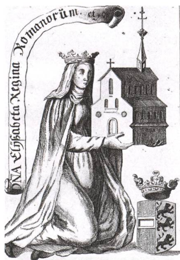
Königin Elisabeth von Habsburg, geborene von Görz-Tirol. Die Witwe des getöteten Königs stiftete das Kloster Königsfelden, dessen Kirche sie in den Händen trägt.

Zunächst galt es, der Klostersgemeinschaft eine solide wirtschaftliche Grundlage zu geben. Agnes kaufte grosse Bauerngüter wie den Lindhof bei Windisch zur Selbstversorgung der Mönche und Nonnen. Vor allem erwarb sie Getreide- und Geldeinkünfte, Zinsen und Zehnten, welche Bauern der näheren und weiteren Umgebung abliefern mussten. Auch löste sie Vermögenswerte ein, die ihr Vater und ihr Grossvater den Adligen als Entschädigung für geleistete Dienste verpfändet hatten. Auf diese Weise wurde Königsfelden im Laufe der Jahrzehnte zu einem der reichsten Klöster weit und breit, reicher als das Kloster Wettingen oder das Fraumünster in Zürich.