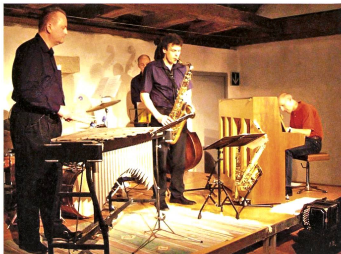
Jazzkonzert Four? Members only , 5. Juni 2009

Die Verantwortung zur Durchführung des Anlasses wird von einzelnen Vorstandmitgliedern wahrgenommen. Unsere Veranstaltungen werden von jeweils etwa 30 bis 100 Gästen, die aus der ganzen Region stammen, besucht. Die Einnahmen aus den Veranstaltungen decken ungefähr einen Drittel bis die Hälfte unserer direkten Anlaskkosten. Finanziell werden wir unterstützt von der Gemeinde Windisch, dem Aargauer Kuratorium, der Neuen Aargauer Bank und unseren rund 400 Gönnerinnen und Gönnern. Allerdings sind unsere Kapazitäten