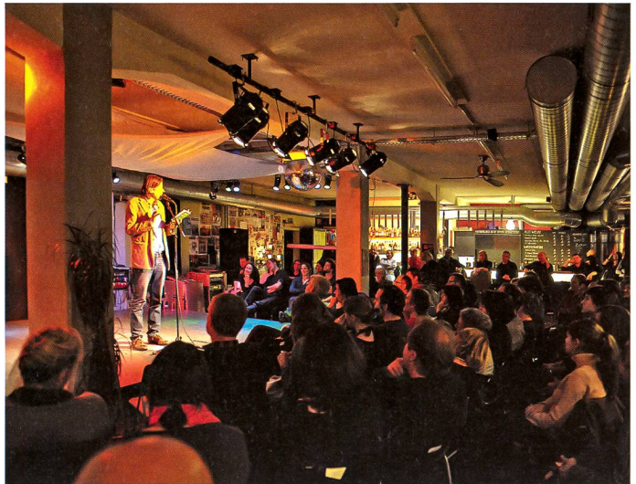
Der Bühnenpoet Pedro Lenz im Dampfschiff in Brugg

Die wichtigsten Programmelemente bilden die 14-tägigen Live-Bar-Konzerte mit vielversprechenden Newcomer-Formationen, die Highlights mit bekannten Namen aus der nationalen bis internationalen Musikszene,