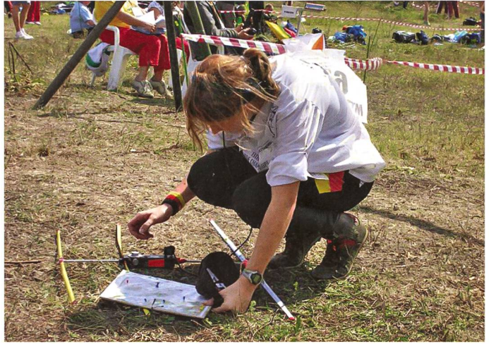
Mit Kartenbrett und UKW-Gerät an einem internationalen Anlass