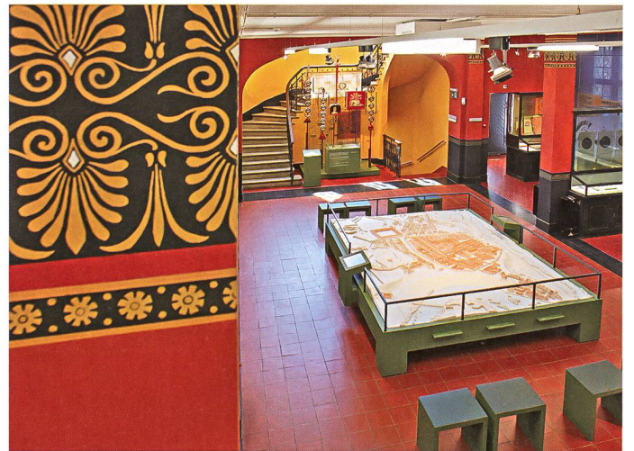
Eintauchen in die Geschichte – auf dem Legionärspfad (oben) und im Vindonissa-Museum