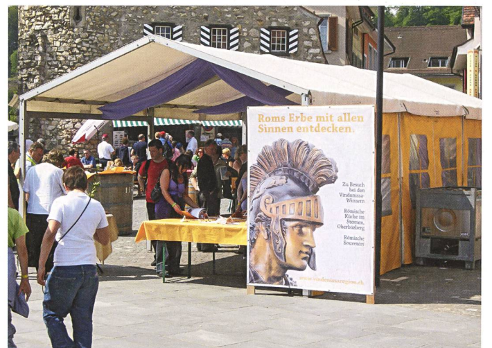
Rom live auf Bruggs Strassen – jeweils am Römertag im Mai