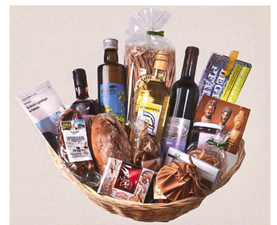
Kulinarische Angebote (v.l.n.r.): Fahrende Taverne, römisches Buffet, Römerkorb