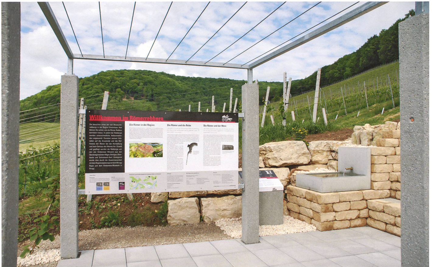
Der Infopavillon des römischen Rebbergs in Remigen

gluschtig daherkommen. Ein tolles Präsent. Der Förderverein «Werkstatt Schenkenbergetal» hat die «Fahrende Taverne» entwickelt. Diese verspricht «Genuss auf Rädern» und bietet eine originelle Abwechslung vom ordinären Bratwurststand an Veranstaltungen: Fast Food, aber nach römischer Art und mit einheimischen Rohstoffen zubereitet.