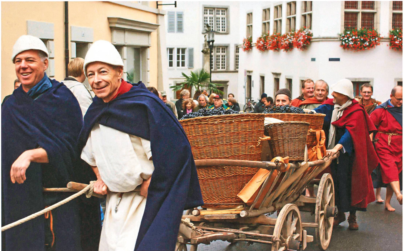
Am 24. Oktober 2010 fuhren die Römerwinzer das erste Traubengut für den Römerwein ein

Rebflächen zeigen jeweils eine spezielle Seite antiker Weinkultur, und einer jeden ist ein Infopavillon zugeordnet. Darin werden verschiedene Aspekte des römischen Rebbaus erläutert: Die Besucher erfahren, wie die Römer Wein anbauten, ihn süssten, würzten, verdünnen. Ab Frühjahr 2011 wird erstmals ein nach römischer Sitte angepflanzter, gepresster und gekelterter Wein erhältlich sein. Beste Werbung für die Römerregion Brugg – und natürlich auch für die beteiligten Winzer. Solche Win-Win-Konzepte sind die Basis für nachhaltigen Erfolg.