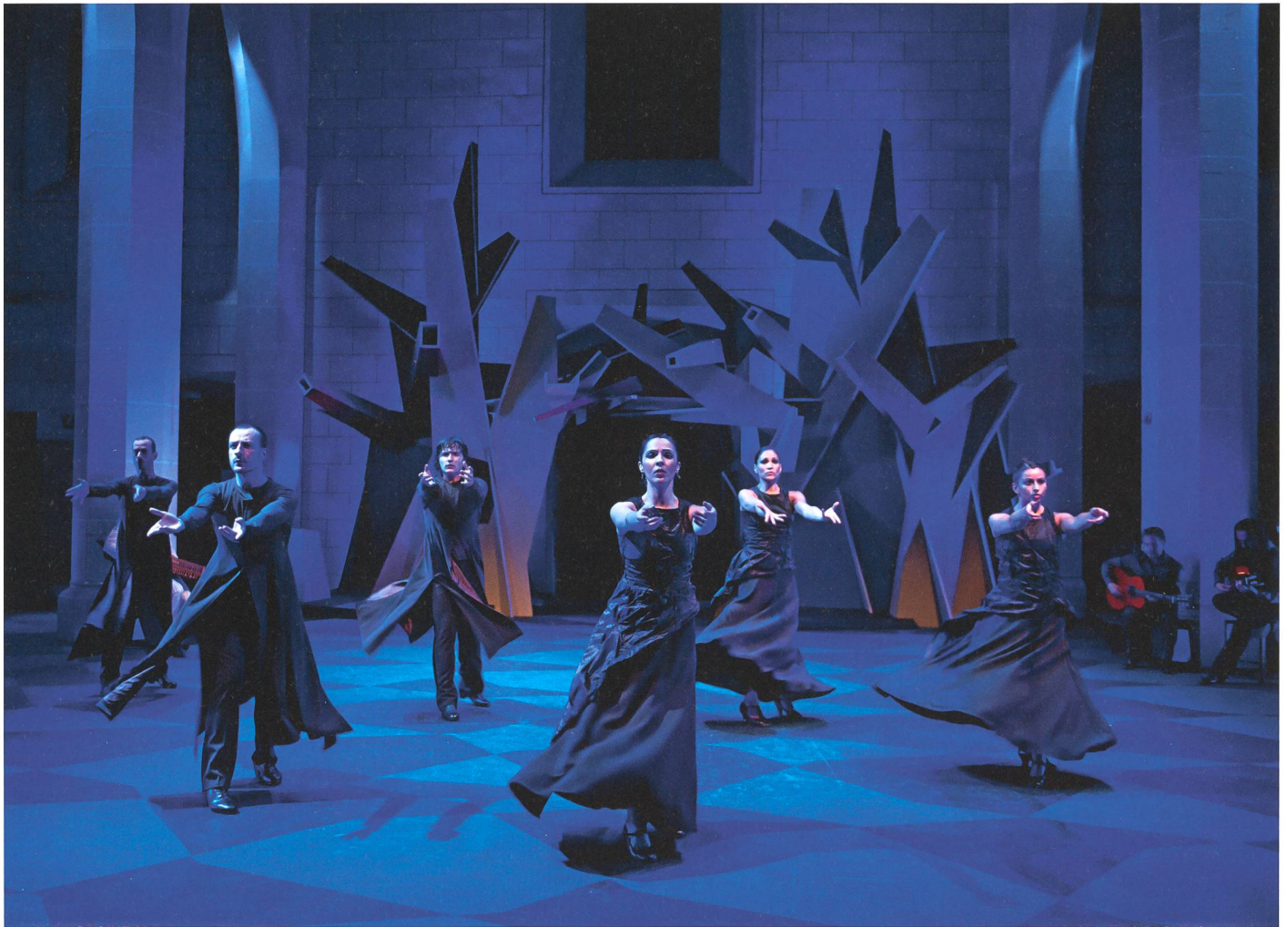
Euridice ist tot – die Nacht bricht herein.