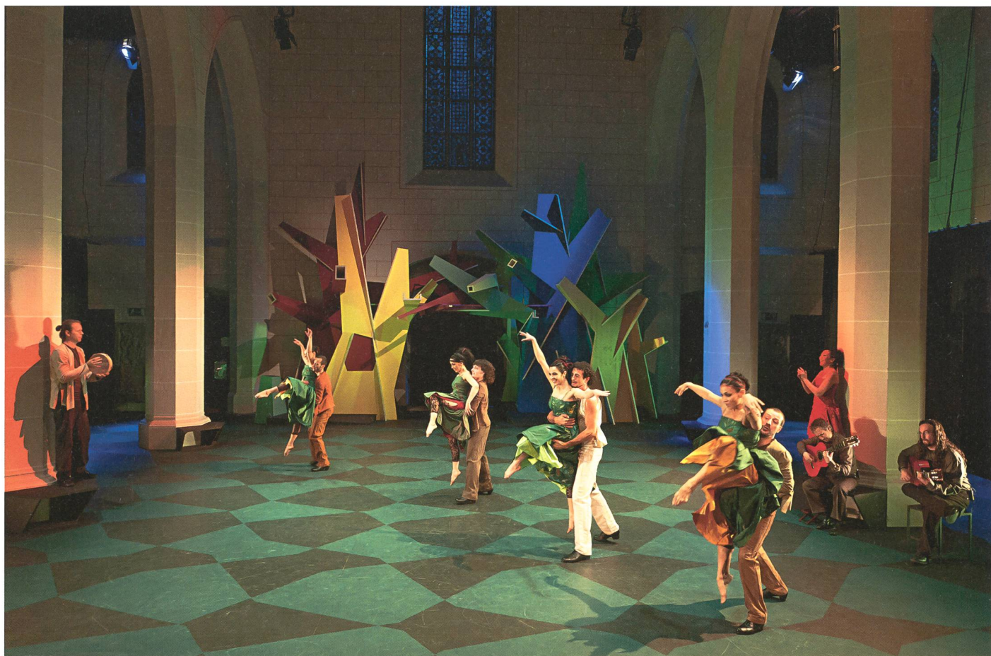
Am Eingang steht die monumentale Holzskulptur «Das Tor zum Paradies»: Beat Zoderer hat für Brigitta Luisa Merkis letzte Königsfelder Choreografie den Raum gestaltet.

Die Choreografin spielt 2011 mehr denn je mit dem «leeren Raum», indem sie die Solisten und das Ensemble oft in die Seitenschiffe verschwinden lässt. Damit trägt Merki