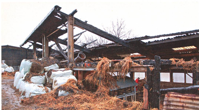
Beim Brand des abgelegenen Berghofes in Veltheim konnten sich Mutterkühe und Kälber selbst retten.