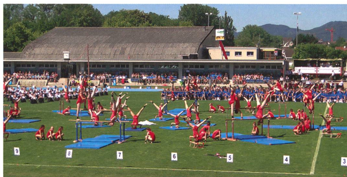
Das Aargauer Kantonalturnfest war im Aargau der grösste Sportanlass des Jahres.

Hoher Besuch: Bundesrat Johann Schneider-Ammann tritt am Parteitag der FDP Aargau in der Sporthalle Mülimatt auf. – Denkwürdige Anlässe: Auf dem Baugelände wird der Grundstein für den Fachhochschul-Campus gelegt, der 2013 bezugsbereit ist. Am Aargauer Kantonalturnfest Brugg-Windisch nehmen 12 000 Aktive teil;