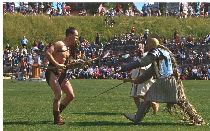
Das restaurierte Amphitheater Vindonissa wurde mit nachgestellten Gladiatorenkämpfen eingeweiht.

Die Generalversammlung des Altersheimvereins Eigenamt verläuft emotional. Der Vorstand tritt zurück. Die