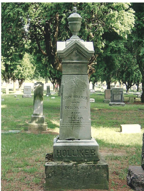
Der Grabstein Johannes Holligers auf dem Gräberfeld seiner Familie (Friedhof Whitehouse, Ohio).