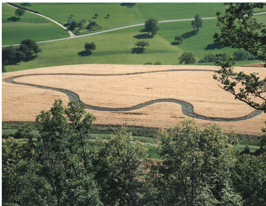
Spur durch Getreidefeld in Thalheim.