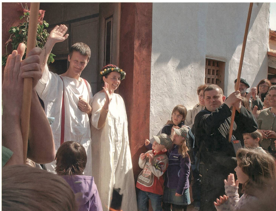
Römische Hochzeit.

Lupfig | Auf dem Flugplatz Birrfeld wird ein weite-ter Hangar für 1,95 Millionen Franken gebaut. Der Aero-Club Aargau bewilligt zusätzlich 0,82 Millio-nen für eine Photovoltaikanlage, die 141 500 kWh Strom erzeugen soll. – Der Backwarenhersteller Hiestand überrascht mit der Mitteilung, er verlage-re den Grossteil der Produktion von Lupfig an den Hauptsitz Schlieren: 194 von 324 Personen sind betroffen.