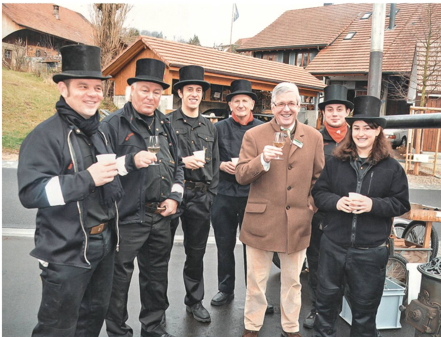
Auftakt zum 800-Jahr-Jubiläum in Auenstein.

Brugg | Die Brandserie in der Nacht auf den 1. August 2011 ist geklärt: Vier junge Erwachsene aus der Region gestehen, für die Vernichtung eines Autos, zweier Schrebergartenhäuschen und des Clubhauses des Vogelschutzvereins verantwortlich zu sein. – An der 148. Rechnungsablage, dem traditionellen «Ripplifrass» des Rettungskorps Brugg, rapportiert Kommandant Roland Leupi über ein ereignisreiches Jahr mit der Integration der Riniker in die Brugger Feuerwehr, der Gründung der Jugendfeuerwehr Wasserschloss Brugg-Windisch-Habsburg-Hausen sowie 101 geleisteten Einsätzen. – Im Kulturzentrum «Dampfschiff» liest der «Rottweiler Stadtschreiber 2011», Catalin Dorian Florescu, aus dem Roman «Jakob beliebt zu lieben», für den er den Schweizer Buchpreis erhielt. – Waffenplatz-Restaurateur Jürg Züllig räumt den Gastrobetrieb im Dufourhaus; die ehemalige Offizierskantine wird für den Kommandositz der Genieschulen umgebaut. – Der Einwohnerrat bewilligt unter der neuen Leitung von Silvia Kistler (FDP) 1,37 Millionen Franken für die Sanierung des Amtshauses; zusätzlich wird ein Lift eingebaut. – Die Narren haben ein weiteres Sujet, weil der Stadtrat das Aufhängen einer Flagge für die Fasnacht 2012 mit einem Werbeaufdruck der Lokalzeitung «Regional» nicht bewilligte.