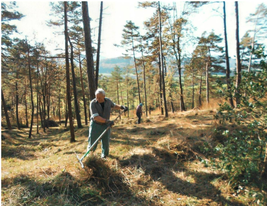
«Zäme Räche»: Freiwillige Helfer heuen im lichten Föhrenwald des Naturschutzgebietes Hessenberg in Bözen.

– Die bei Ausgrabungen freigelegten Aquädukt Pfeiler der einstigen römischen Wasserleitung von der Oberburg ins Legionslager Vindonissa müssen der Neuüberbauung zwischen Hauser- und Dohlenzelgstrasse weichen; die Erhaltung hätte den Kanton eine Million Franken gekostet. – Die Psychiatrischen Dienste Aargau setzen einen Planerwettbewerb für die Gesamtanierung der Klinik Königsfelden im Kostenumfang von 125 Millionen Franken in Gang. – Die Pläne zur Erweiterung des Pflegeheims Lindenpark liegen auf; der Bettenbestand wird von 97 auf 120 erweitert. – Die Vindonissa Singers feiern den 40. Geburtstag; sonst auf englische Popmusik eingeschworen, heisst ihr Jubiläumsprogramm «SING!Düütsch».