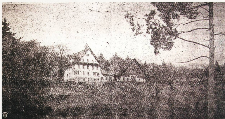
Erinnerstätte Stiftung von Effinger-Hort, Holderbau.

Dies ist das allererste Foto als Ergänzung zu einer Berichterstattung im «Aargauischen Hausfreund und Brugg-Anzeiger».