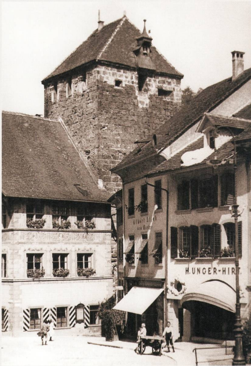
Ladengeschäft an der Hauptstrasse. Im Hintergrund das Wahrzeichen von Brugg