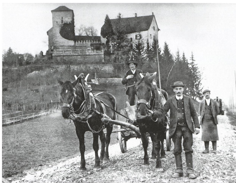
Schloss Wildenstein zu Beginn des 20. Jahrhunderts (1913).