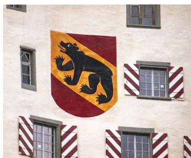
Die Berner Herrschaft ist ein fester Bestandteil der Schlossgeschichte Wildensteins. Das Schloss gehörte 1415 bis 1798 zum Staate Bern und war 1720 bis 1798 Sitz der Landvogtei Schenkenberg.