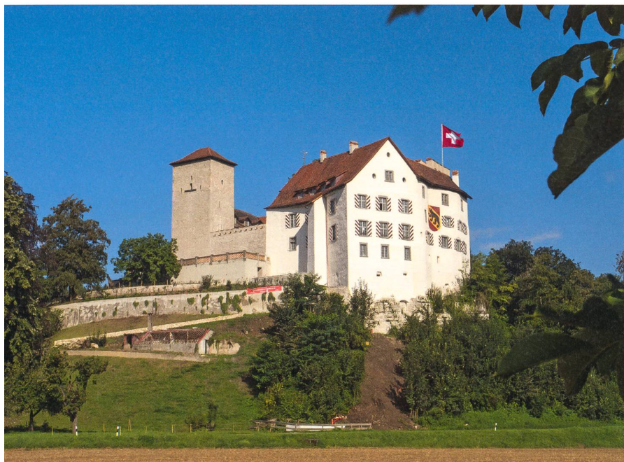
Seit 2014 erstrahlt das Schloss Wildenstein in neuem Glanz.

Wildensteins Wurzeln liegen in der Feudalzeit, Wildensteins Geschichte gehört zum grössten Teil der Neuzeit an. Reich an Drama – wer wird als Schlossherr geboren, wer erbt, mit der Schwester zusammen, zwei Schlösser – kennt sie Arroganz und Klasse, Religiosität und Humanität, Träume, die verfliegen und Träume, die wahr werden.