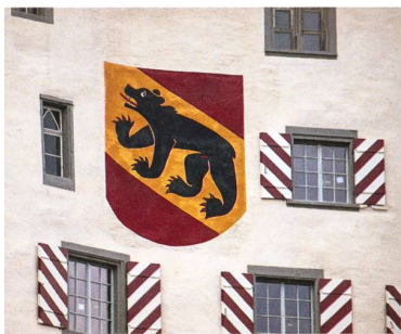
Die Berner Herrschaft ist ein fester Bestandteil der Schlossgeschichte Wildensteins. Das Schloss gehörte 1415 bis 1798 zum Staate Bern und war 1720 bis 1798 Sitz der Landvogtei Schenkenberg.