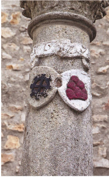
Adelswappen zeugen von den früheren Schlossbesitzern (die Familie von Mülinen und die Effingers).