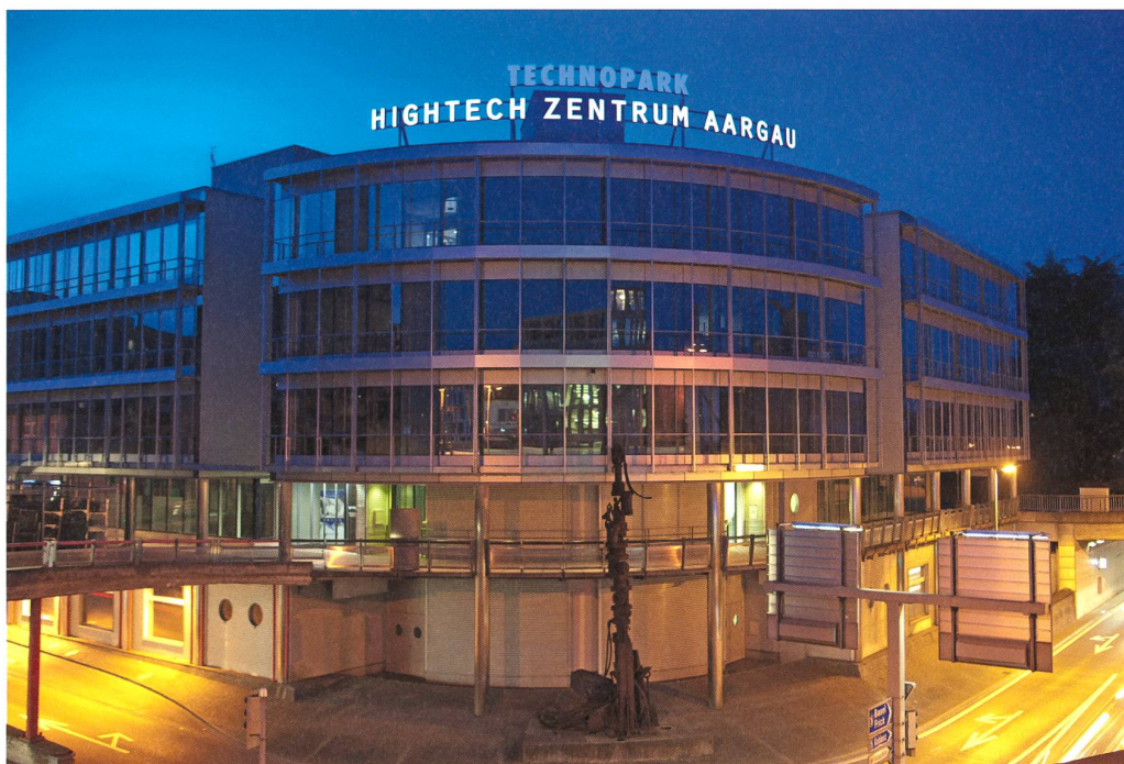
Technopark und Hightech Zentrum tragen wesentlich zur Standortattraktivität unserer Region bei.