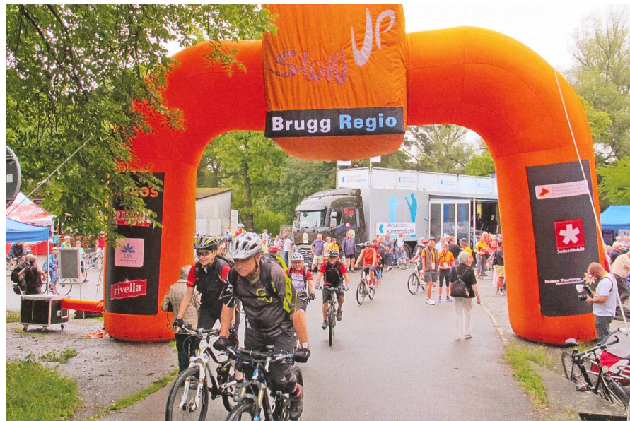
Bei zunächst feuchter, später immer freundlicherer Witterung findet der 2. slowUp Brugg Regio statt.

Künstlern aus der Region. Im Rahmenprogramm kommt die vielseitige Ausrichtung des Kulturhauses zur Geltung, das sich die Stadt Brugg 1984 zur 700-Jahr-Feier geleistet hatte.