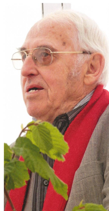
Mit Helmut Hubacher tritt an der Brugger 1.-Mai-Feier ein politisches Schwergewicht auf.

Brugg | Helmut Hubacher, alt Nationalrat und alt Präsident der SP Schweiz, spricht auf dem Neumarktplatz zum Tag der Arbeit. – Vor 150 Jahren öffnete die Stadtbibliothek mit 756 Büchern, heute sind es 28 200 Medien; dem Wunsch nach mehr Platz wird auch mit der bevorstehenden Renovation des Zimmermannhauses vorläufig nicht entsprochen werden können. – Pranee Peder, die in der Region bereits auf den Märkten und mit einem Liefer- und Partyservice erfolgreich ist, erweckt den Umiker «Löwen» zu neuem Leben. – Die von rund