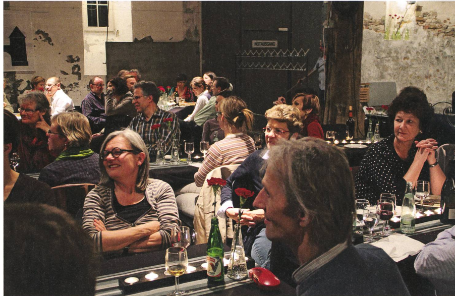
Literaturfest 2010: Im «Epizentrum» Salzhaus fühlt sich das Publikum wohl.

Und hier noch eine kleine Schlusszene: Sonntagmorgen, 21. September 2014, im Salzhaus. Auf der Bühne sitzen zehn Schriftstellerinnen und Schriftsteller an einem langen, mit einem schwarzen Tuch bedeckten Tisch. Im Saal das recht zahlreiche Publikum, ruhig und erwartungsfroh. Die Stimmung ist fast feierlich. Verteilt zwischen den Leuten stehen Gymnasiasten der Kantonsschule Wettingen. Die Schüler lesen Romananfänge und kommentieren sie. Dann folgen kleine Geschichten, die sie selbst verfasst haben und die beginnen mit: «Es war einmal.» Für die Schüler könnte dieser Satz auch bedeuten: «Es wird einmal.» Der Anlass könnte für einzelne unter ihnen zur Motivation werden, die Literatur oder das Schreiben als Beruf zu wählen, wie damals bei der jungen Birgit Schmid.