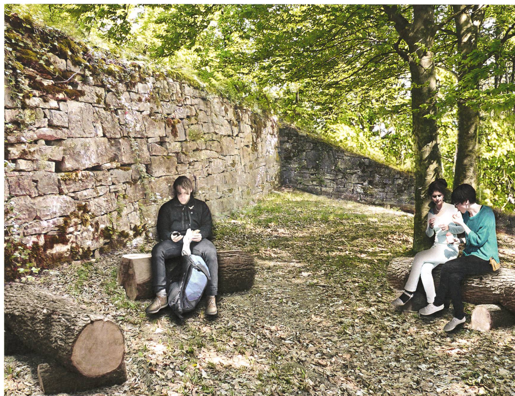
Der einzigartige Landschaftscharakter bietet das grosse Potenzial für die Nutzung als Aufenthaltsort.