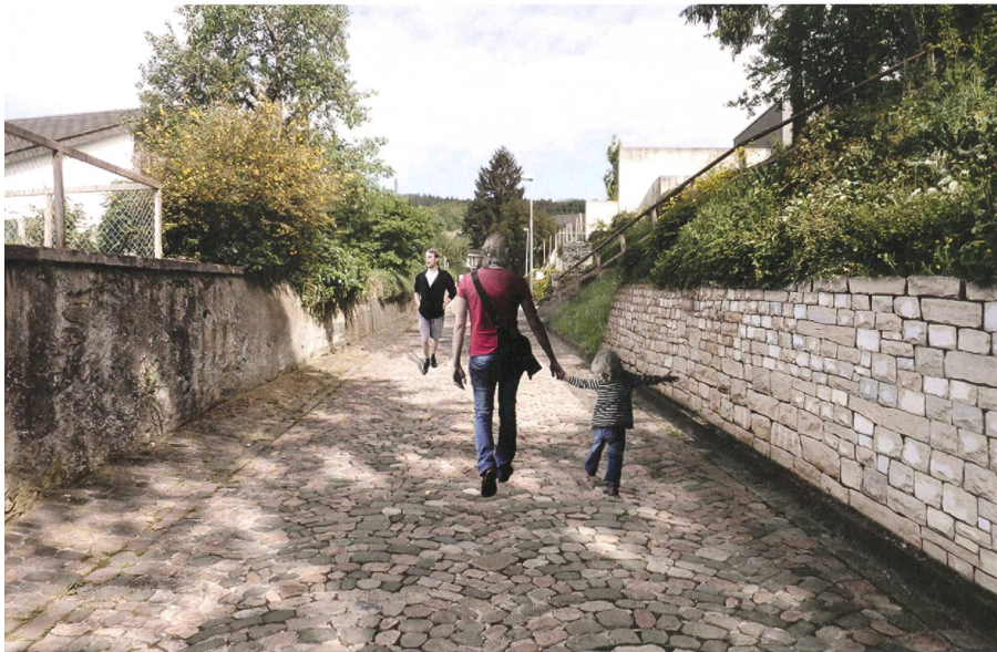
Die alte Gasse heute ... ... und nach dem Neuaufbau der Trockensteinmauern.