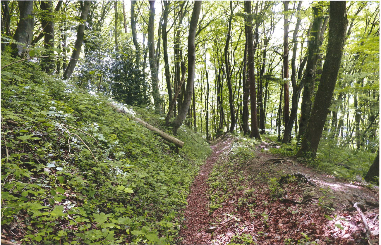
Der benutzte Hohlweg auf der südlichen Linienführung führt durch einen hallenartigen Orchideen-Buchenwald.