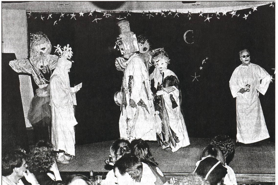
Pfarreikeller «zum Fünften» (1995) D'Brugger Gschpängschtl

Legendar war die Festbeiz «zur lachenden Wildsau» am Stadtfest 1984, die von den Värslischmitte -Leuten als «gestiefelte Musketiere» im Landschreibereikeller mit Grandezza betrieben wurde. An der Fasnacht 1985 zog die grosse Gruppe der Insektuellen 10 die Zuhörenden mit ungenierten Versen in ihren Bann.