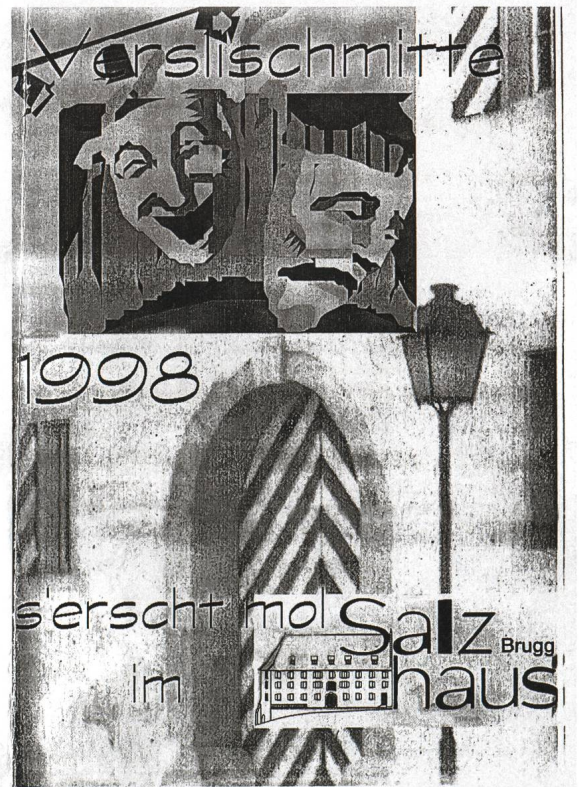
Umschlag der Speisekarte Salzhaus vom «ersten Mal» (1998)