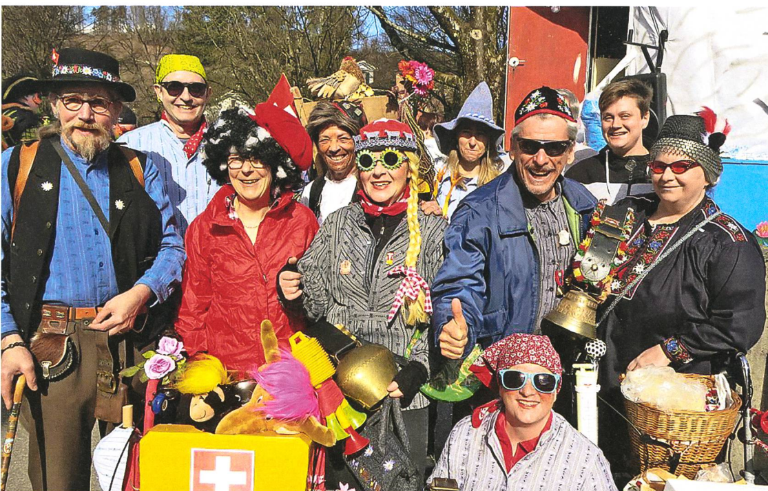
Die Delegation der Äplerhilbi am Umzug (2017)

immer wieder angefressene Fasnächtler, die mit Herzblut und kreativen Händen zum Deko-Pinsel, zum Schmiedehammer, zur Kochkelle und zum Serviertablett greifen ... Es lebe die Värslischmitte!