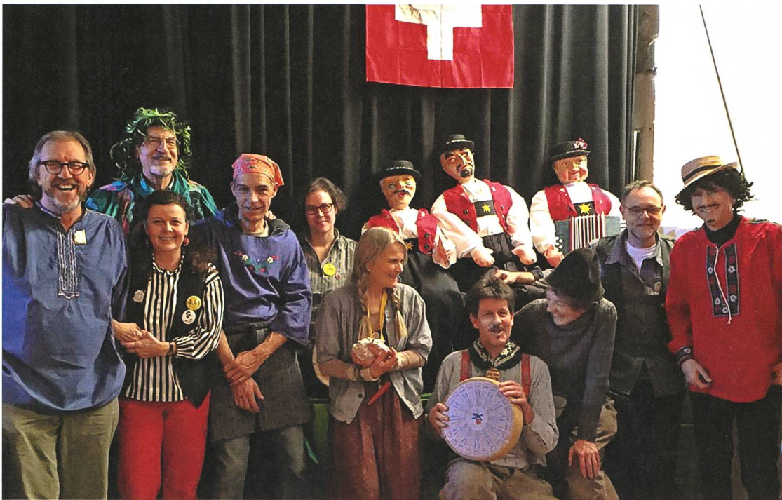
Einige Aktivisten der Äplerhilbi im Salzhaus (2017)