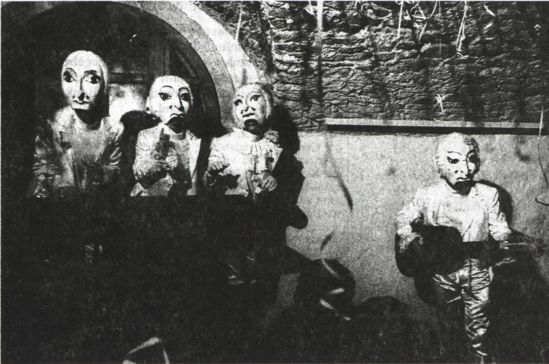
Landschreiberei «die Letzte» (1988) D'Jubilante

Der Autor als Dienstältester der Brugger Bänkler schmiedete für die Fasnacht 1977 erstmals eigene Verse. Dazu inspiriert wurde er von Jean , dem legendären Badener Solisten mit der Pauke. Der Auftritt als Ganovo in den Brugger Beizen wurde beim Maskenball der Konfettispalter – hier mit Mikrofon – mit einem Preisgeld als «Einzelmaske» gekrönt. Derart angespornt machte der Bänkler im nächsten Jahr wieder aktiv mit, diesmal als Zuelueger . Damit war auch sein Markenzeichen geboren: jedes Jahr ein neuer, mit Ironie vom offiziellen Fasnachtsmotto entliehener Name. Als roter Faden in seinen Auftritten der vom Publikum gesungene Refrain «Ei du schöne, ei du schöne, ei du schöne Schnitzelbank...!» 1978 ebenfalls dabei ein Duo Stürmi und Nörgeler 1 ( Anmerkungen im Anhang ), und auch die Rrätz-Clique und die Aarefäger wagten sich mit einer Bank an die fasnächtliche Öffentlichkeit. Diese bestand aus nicht weniger als elf dekorierten Restaurants, u. a. Druckli, Scharf Eck, Fuchs, Gotthard und Rotes Haus (im offiziellen Programm 1980), später auch Sonnenberg. Hier wurden die Bänkler am Donnerstag- und Samstagabend sowie am Sonntag nach dem Umzug zumeist freudig begrüsst.