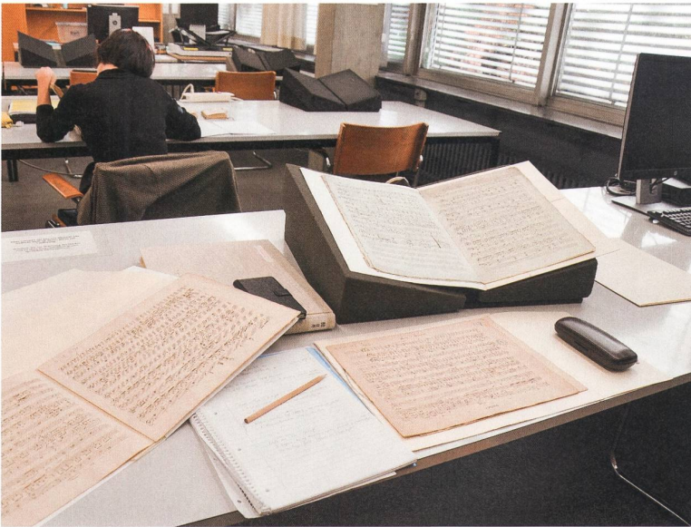
Arbeitsplatz im Sonderlesesaal der Abteilung Handschriften und Alte Drucke Universitäts- bibliothek Basel