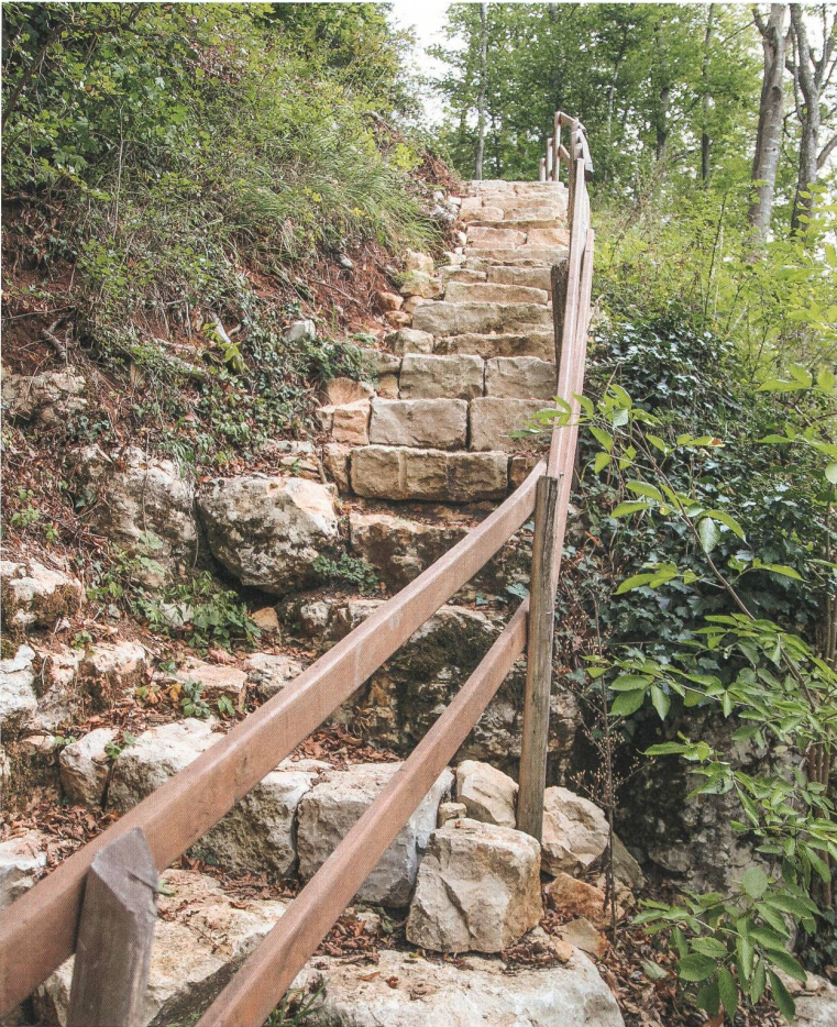
Eine neue Treppe führt zur Höhle hinunter