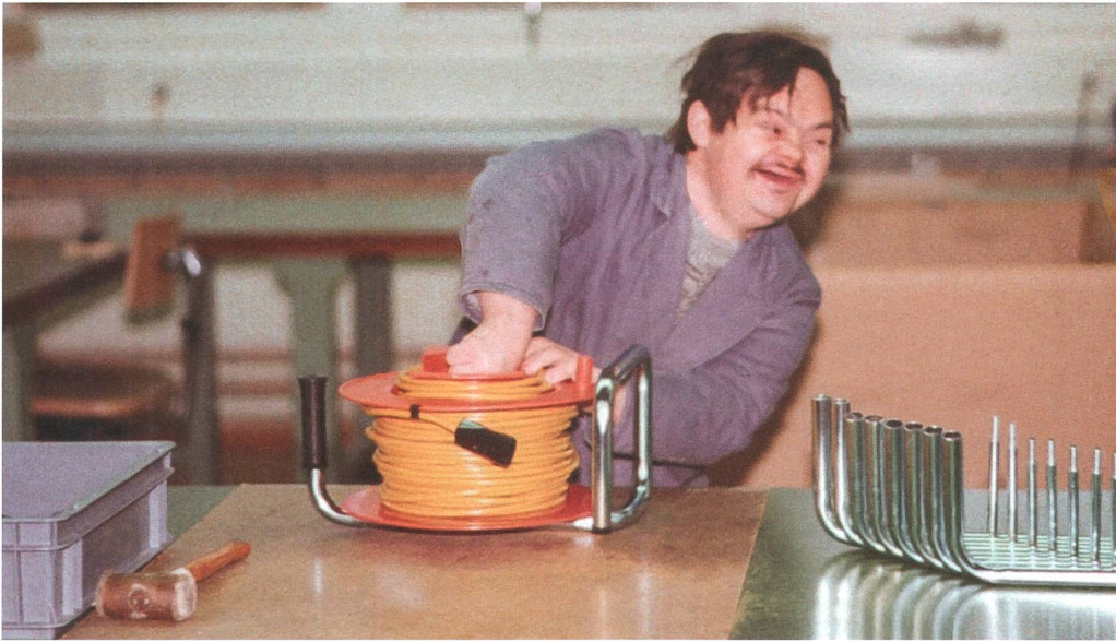
Seit jeher im Mittelpunkt aller Bemühungen der Stiftung: Mitarbeiter, gut gelaunt