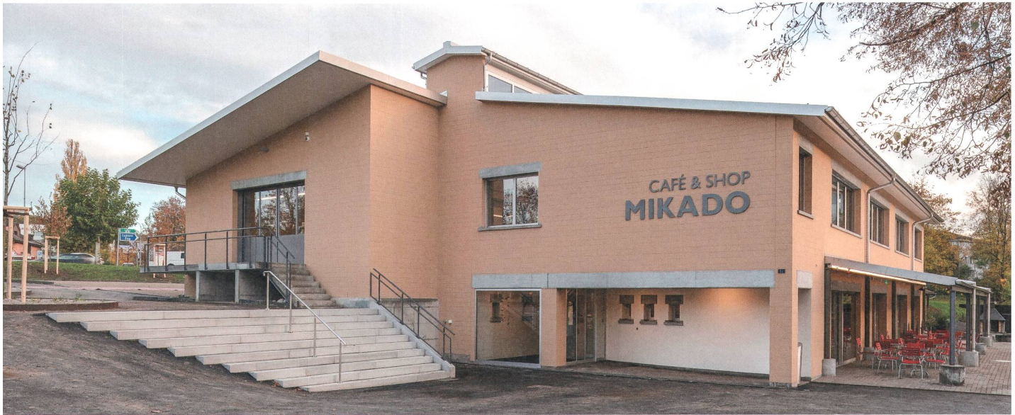
Erstrahlt in neuem Glanz: Das Mikado Windisch nach der umfassenden Erneuerung mit Café & Shop, Kunst- handwerk und Werkatelier. November 2018

Seit 2012 erscheint der Jahresbericht – gemäss Stiftungsurkunde wird dieser stets öffentlich bekannt gemacht – als kompakter Newsletter «unterwegs».