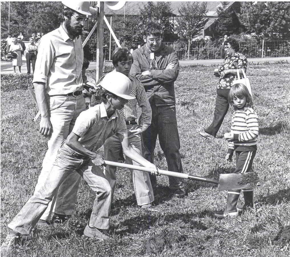
Mit Elan voran: Spatenstich für die Regionale Werkstatt Windisch, Habsburgstrasse. August 1982

und der (noch nicht renovierten) Bossartschür als rustikale Beiz. Das Volk strömte in Scharen zum Fest, die Gemeinden des Bezirks bildeten ein Patronatskomitee zur solidarischen Unterstützung des Vorhabens «Werkstatt für Menschen mit Behinderung», und entsprechend grandios war der Erlös von gegen 250 000 Franken.