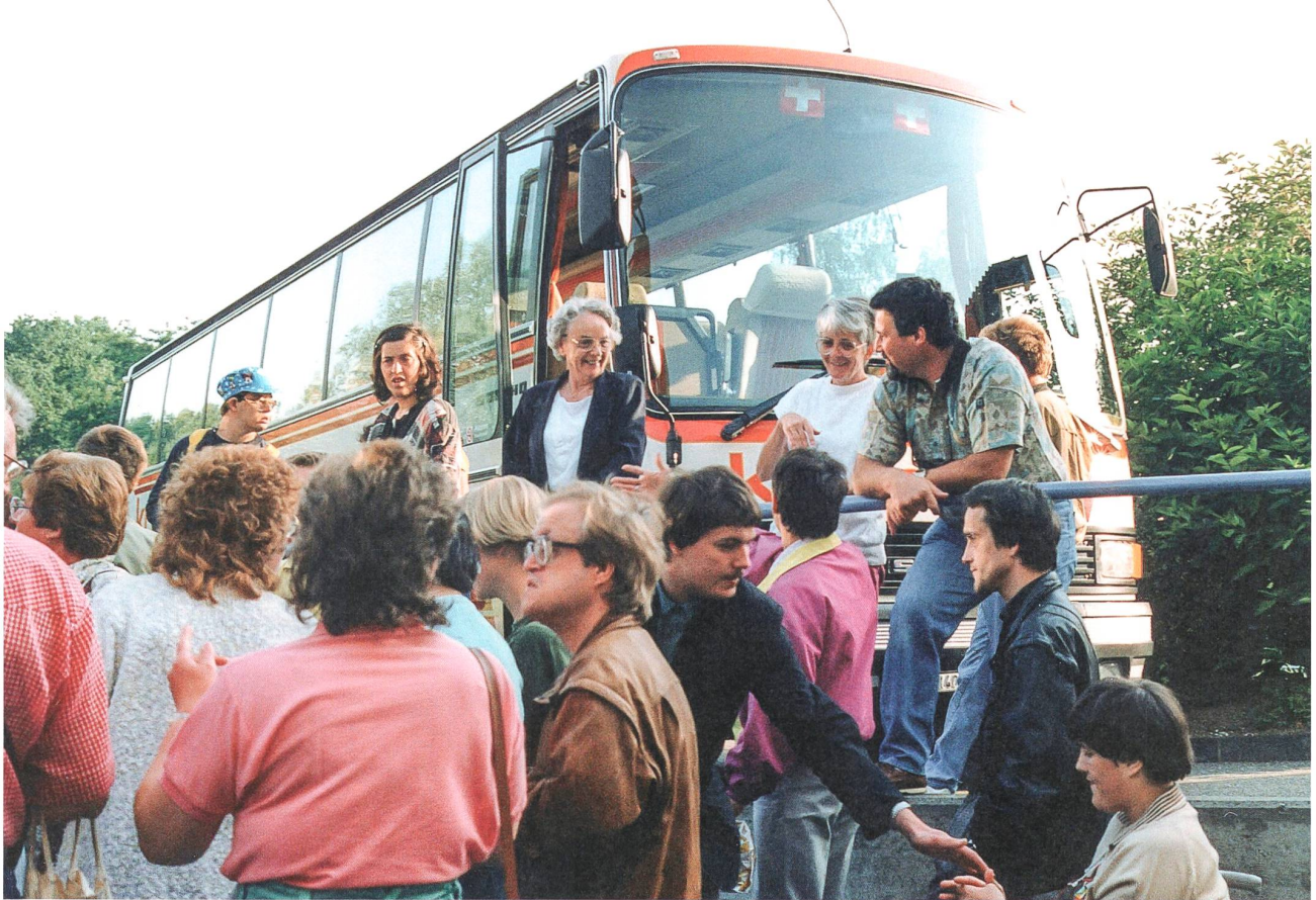
Immer wieder Reisefieber: Lagerwochen und Betriebs- ausflüge nach dem Motto: «Tapetenwechsel darf, ja muss sein»