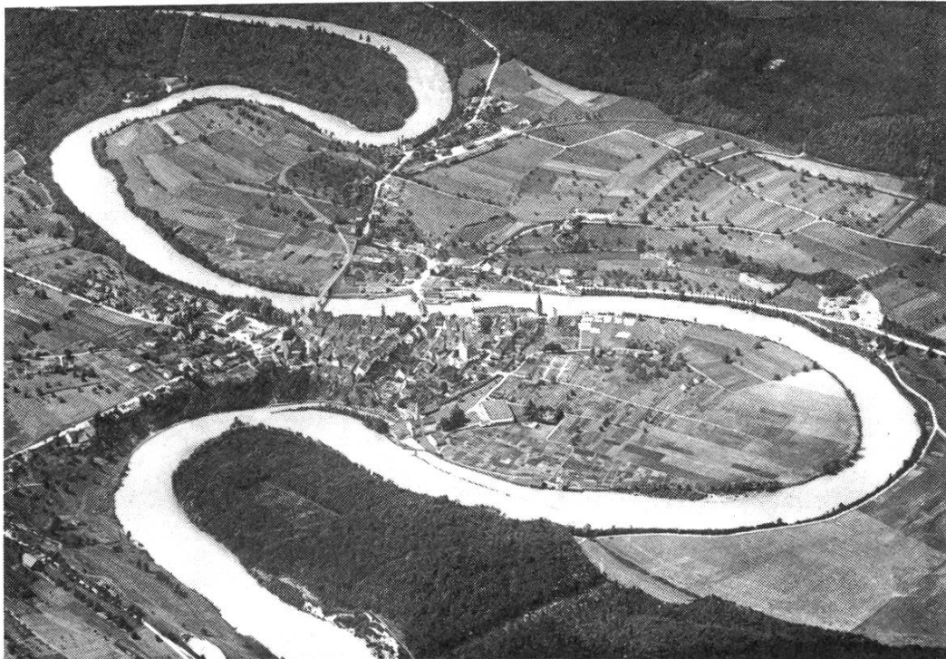
Abb. 1: Bremgarten vor 1920. Die Stadt und ihre Aussenquartiere werden von landwirtschaftlichen Flächen umschlossen.

stehen wir mitten in einem totalen Umbruch der heimatlichen Landschaft. Die menschliche Siedlungstätigkeit füllt nach und nach die vorhandenen Talräume von Waldrand zu Waldrand auf. Am Beispiel des Gemeindebannes Bremgarten lässt sich diese Entwicklung gut aufzeigen. Betrachten Sie einmal das Flugbild (Abb. 1), das vor 1920 von einem Pionier der schweizerischen Luftfahrt aufgenommen wurde. Es zeigt die Altstadt mit ihren Erweiterungen beim Schulhaus, beim Waagplatz und im Westgebiet, umgeben von Feldern, Äckern und Baumgärten.