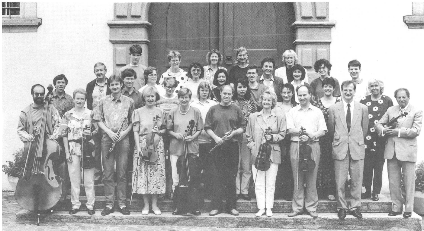
Bild: Orchesterverein Bremgarten im Sommer 1993