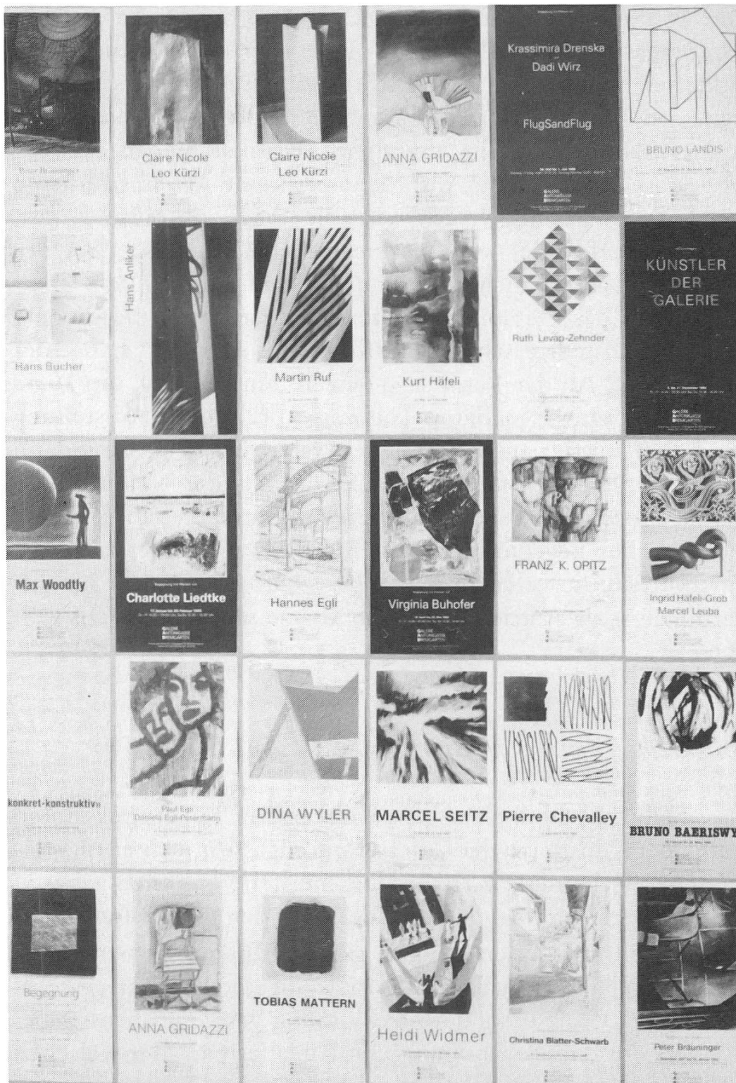
Ausstellungsplakate 5 Jahre Galerie